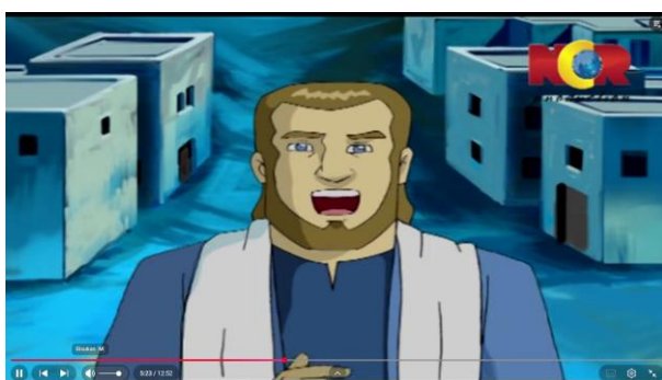
Gambar 3.21 Nabi Yunus Berdakwah

Berikut adalah adegan yang mengandung nilai pendidikan aqidah: