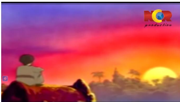
Gambar 3.1 Ibrahim Mencari Tuhan

Berikut adalah adegan yang mengandung nilai pendidikan aqidah: