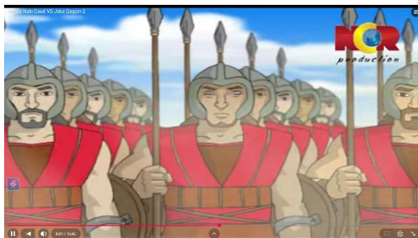
Gambar 3.9 Pasukan Bani Israil bersiap berangkat Perang

Berikut adalah adegan yang mengandung nilai pendidikan akhlak: