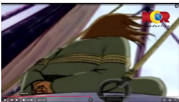
Gambar 3.4 Ibrahim diikat

Berikut adalah adegan yang mengandung nilai pendidikan akhlak: