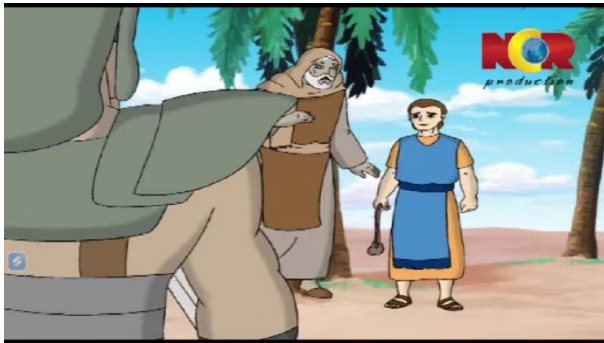
Gambar 3.8 Daud menolong Seorang Kakek

Berikut adalah adegan yang mengandung nilai pendidikan akhlak: