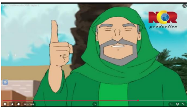
Gambar 3.20 Khidir menerangkan Kejadian kepada Nabi Musa

Berikut adalah adegan yang mengandung nilai pendidikan akhlak: