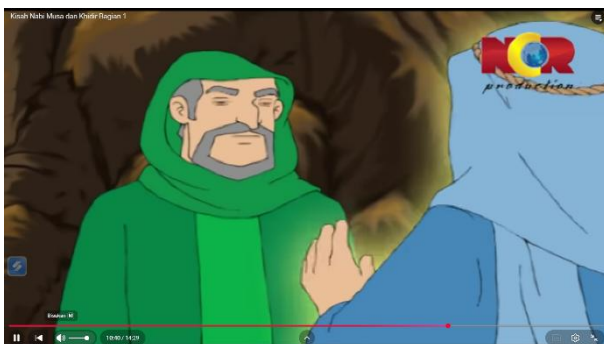
Gambar 3.18 Nabi Musa meminta untuk berguru kepada Khidir

Berikut adalah adegan yang mengandung nilai pendidikan akhlak: