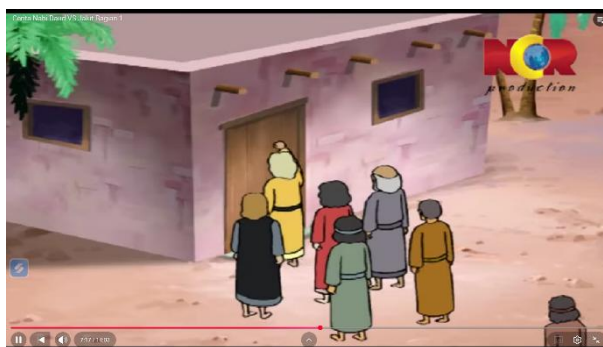
Gambar 3.11 Bani Israil mendatangi Rumah Nabi Samuel

Berikut adalah adegan yang mengandung nilai pendidikan ibadah: