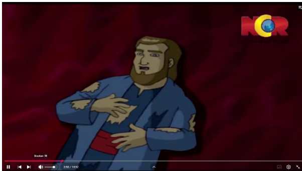
Gambar 3.25 Nabi Yunus dalam Perut Paus

Berikut adalah adegan yang mengandung nilai pendidikan akhlak: