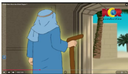
Gambar 3.13 Perintah Allah untuk Menemui Khidir

Berikut adalah adegan yang mengandung nilai pendidikan aqidah: