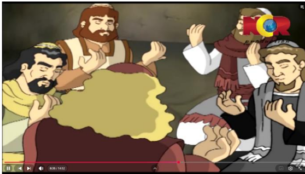
Gambar 3.26 Kaum Ninawa Berdoa dipertemukan dengan Nabi Yunus

Berikut adalah adegan yang mengandung nilai pendidikan ibadah: