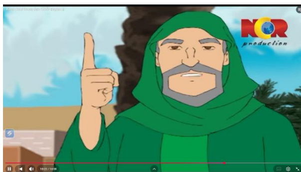
Gambar 3.15 Khidir Menyampaikan Pesan

Berikut adalah adegan yang mengandung nilai pendidikan aqidah: