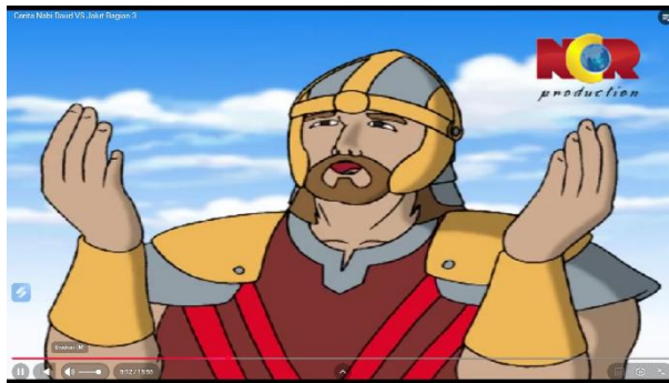
Gambar 3.12 Thalut memimpin Doa

Pada adegan menit 05.02 hingga 05.28 episode 3, terdapat adegan Thalut yang memimpin seluruh pasukannya untuk berdoa bersama kepada Allah sebelum pertempuran dimulai. Seluruh pasukan memanjatkan doa memohon kesabaran, keteguhan, dan pertolongan Allah dalam menghadapi pasukan Jalut.