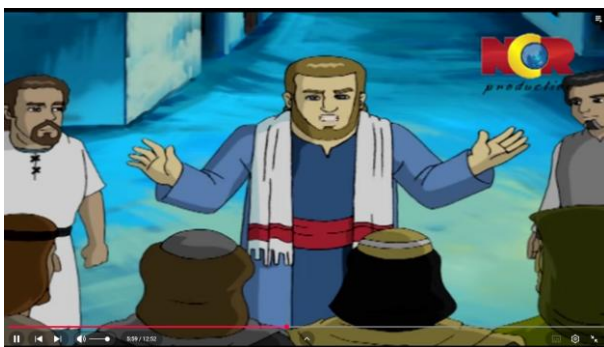
Gambar 3.22 Nabi Yunus Menerangkan Kuasa Allah

Berikut adalah adegan yang mengandung nilai pendidikan aqidah: