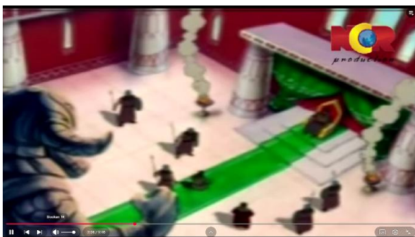
Gambar 3.2 Perdebatan Nabi Ibrahim dan Raja Namrud

Berikut adalah adegan yang mengandung nilai pendidikan aqidah: