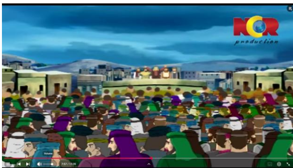
Gambar 3.24 Kaum Ninawa Bertaubat

Berikut adalah adegan yang mengandung nilai pendidikan akhlak: