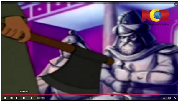
Gambar 3.3 Ibrahim Menghancurkan Berhala

Berikut adalah adegan yang mengandung nilai pendidikan akhlak: