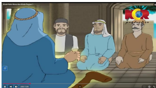
Gambar 3.16 Nabi Musa Berceramah

Berikut adalah adegan yang mengandung nilai pendidikan akhlak: