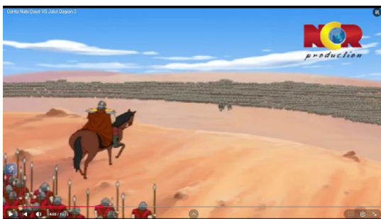
Gambar 3.7 Bani Israil berhadapan dengan Pasukan Jalut

Berikut adalah adegan yang mengandung nilai pendidikan aqidah: