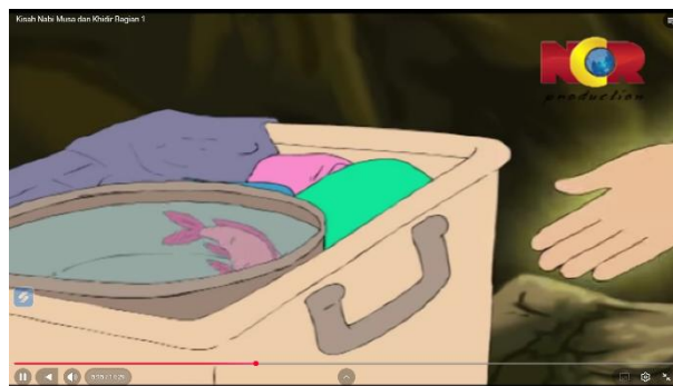
Gambar 3.14 Ikan sebagai Petunjuk

Berikut adalah adegan yang mengandung nilai pendidikan aqidah: