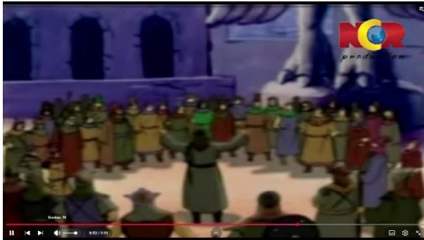
Gambar 3.5 Nabi Ibrahim Berdakwah

Pada menit 06.18 hingga 08.05 episode 1, terdapat adegan Nabi Ibrahim AS yang telah dewasa dan diangkat menjadi utusan Allah, kembali kepada kaumnya di Babilonia untuk menyeru mereka agar meninggalkan penyembahan berhala dan kembali menyembah Allah. Nabi Ibrahim menjelaskan kepada kaumnya bahwa berhala-berhala yang mereka sembah tidak memiliki kekuatan apapun untuk menolong. Meskipun seruannya dianggap sebagai penghinaan dan ia menghadapi berbagai ancaman, Nabi Ibrahim tetap teguh dan tidak gentar karena ia meyakini bahwa hanya Allah yang patut ditakuti.