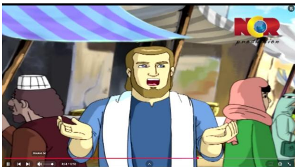
Gambar 3.23 Nabi Yunus Berdakwah dipasar

Pada menit 07:21–08:57 episode 1 film animasi Syamil Dodo, terdapat adegan yang menampilkan Nabi Yunus mendatangi pasar di Kota Ninawa dan menyaksikan berbagai bentuk kezaliman yang dilakukan oleh masyarakat setempat, seperti penindasan dan perjudian. Nabi Yunus kemudian menasihati mereka agar meninggalkan perbuatan tersebut dan kembali kepada ajaran Allah. Masyarakat Ninawa justru menolak nasihat tersebut dan mengusir Nabi Yunus agar kembali ke negeri asalnya.