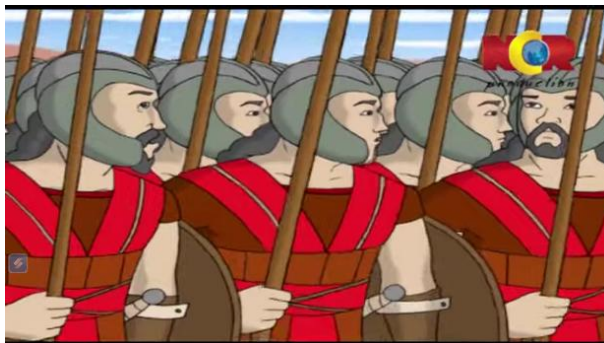
Gambar 3.10 Pasukan Bani Israil tergoda meminum Air Sungai

Berikut adalah adegan yang mengandung nilai pendidikan akhlak: