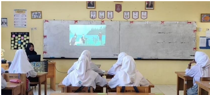
Gambar 4.6 Peserta Didik Menyimak Tayangan Video Pembelajaran

Pada kegiatan inti, Ibu NLR menayangkan video singkat berisi kisah sengketa waris yang diakhiri dengan perdamaian atau kearifan. Kemudian Ibu NLR meminta peserta didik untuk mencermati video tersebut dan memberikan tanggapan, salah satu peserta didik memberikan tanggapan berupa “Menurut saya, video tersebut mengajarkan bahwa sengketa waris sebaiknya diselesaikan dengan musyawarah. Perdamaian yang terjadi mencerminkan pentingnya menjaga hubungan keluarga sesuai dengan nilai keadilan dalam Islam.” lalu Ibu NLR mengapresiasi dengan memberikan tepuk tangan serta pujian “ Good job , ayo yang lain lagi sampaikan tanggapannya”.