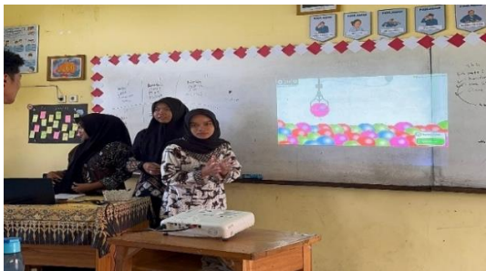
Gambar 4.2 Guru Mengintegrasikan Teknologi dalam Strategi Pengajaran

selesai menjelaskan terkadang masih ada beberapa peserta didik yang duduk dikursi belakang terlihat berbicara dengan teman sebangku, ada yang mengantuk dan memainkan benda-benda lainnya ketika belajar, namun dalam hal tersebut Ibu NLR mampu mengatasi dengan menegur secara halus, memberikan pertanyaan-pertanyaan dadakan tentang materi, ataupun melakukan ice breaking.