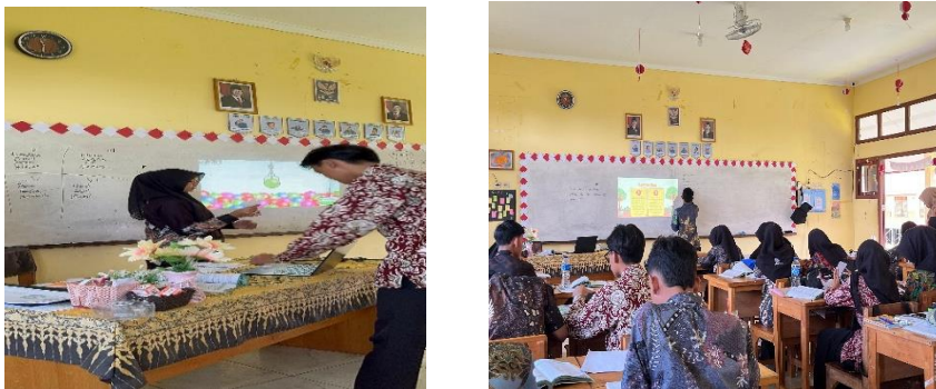
Gambar 4.3 Keterlibatan Aktif Peserta Didik selama Pembelajaran

Terakhir dibagian kegiatan penutup, Ibu NLR memberikan kesempatan kepada peserta didik untuk bertanya jika ada materi yang kurang dipahami. Kemudian ada satu peserta didik yang bertanya kembali mengenai materi tersebut “Bagaimana hukum warisnya, jika seorang anak membunuh ayah kandungnya”. Dan beliau menjelaskan kembali bagian materi yang kurang dipahami peserta didik tersebut, “Hukum waris anak tersebut adalah tidak mendapatkan warisan karena