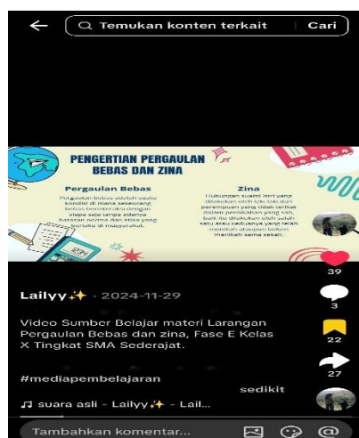
Gambar 4.7 Link (Inovasi Baru dalam Pembelajaran PAI di SMAN 3 Martapura)

Saya sering mengikuti MGMP dan kegiatan pelatihan seperti workshop, IHT ( Inhouse Training ), dan bimbingan teknologi (bimtek). Karena dengan mengikuti kegiatan-kegiatan tersebut, saya bisa mengembangkan kemampuan yang sudah dimiliki, kemudian juga menambah pengetahuan saya kepada hal-hal yang belum diketahui, diantaranya seperti memudahkan dalam menyiapkan pembelajaran yang menggunakan TPACK tersebut, misalnya ketika kita tidak mempunyai banyak waktu dalam merancang modul ajar ternyata kita bisa loh memanfaatkan AI untuk membantu menentukan komponen-komponen apa yang ingin dimunculkan pada pembelajaran, cukup mengarahkan dengan prompt yang jelas dan AI yang akan membantu membuat, sehingga guru tidak sulit lagi untuk membuat modul ajar secara manual dan juga bisa memilih template mana yang bagus untuk materi ajar. Selain itu, kita juga bisa tau tentang platform daring apa saja yang terbaru untuk menjadi sumber belajar anak selain buku paket, bahkan kita juga bisa mengetahui game-game edukatif yang bisa diaplikasikan dalam pembelajaran agar anak kita tidak bosan karena kita hanya menggunakan satu jenis game itu-itu aja. Artinya AI itu sangat memudahkan dan membantu bagi guru dalam merancang dan menyiapkan pembelajaran. 92