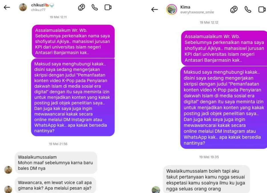
Gambar izin 2 Akun @chiku.z77 (kiri) Akun @everyhxwoone.smile (kanan)