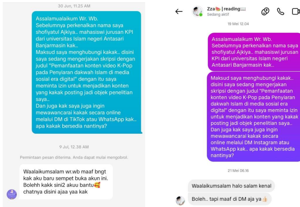
Gambar izin 1 Akun @kpopers.halal (kiri) Akun @impijjaa (kanan)