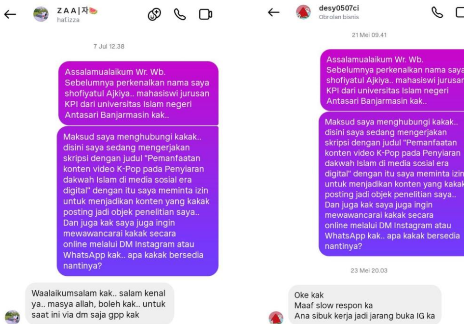
Gambar izin 4 Akun @haf.izza (kiri) Akun @desy0507ci (kanan)