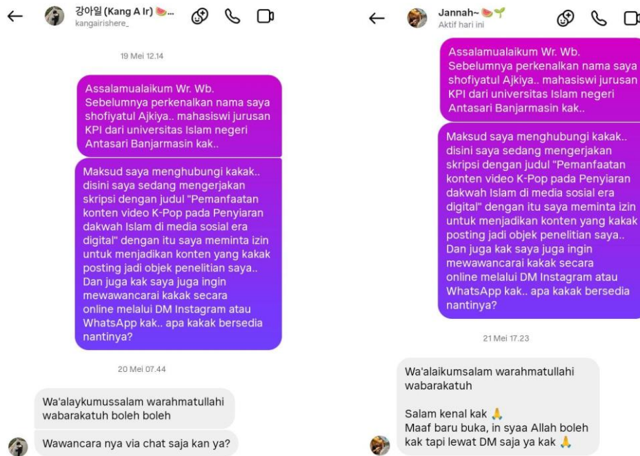
Gambar izin 3 Akun @kangairishere_ (kiri) Akun @jannah127 (kanan)