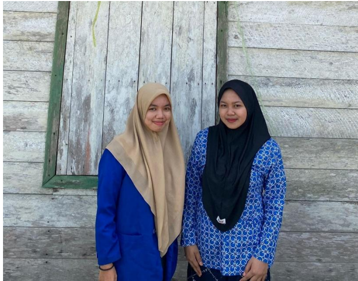
Gambar 3 Wawancara dengan Guru Pendidikan Agama Islam