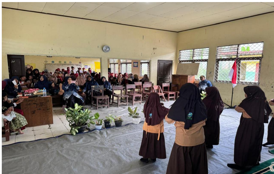
Gambar 9 Rapat Sekaligus Acara Perpisahan