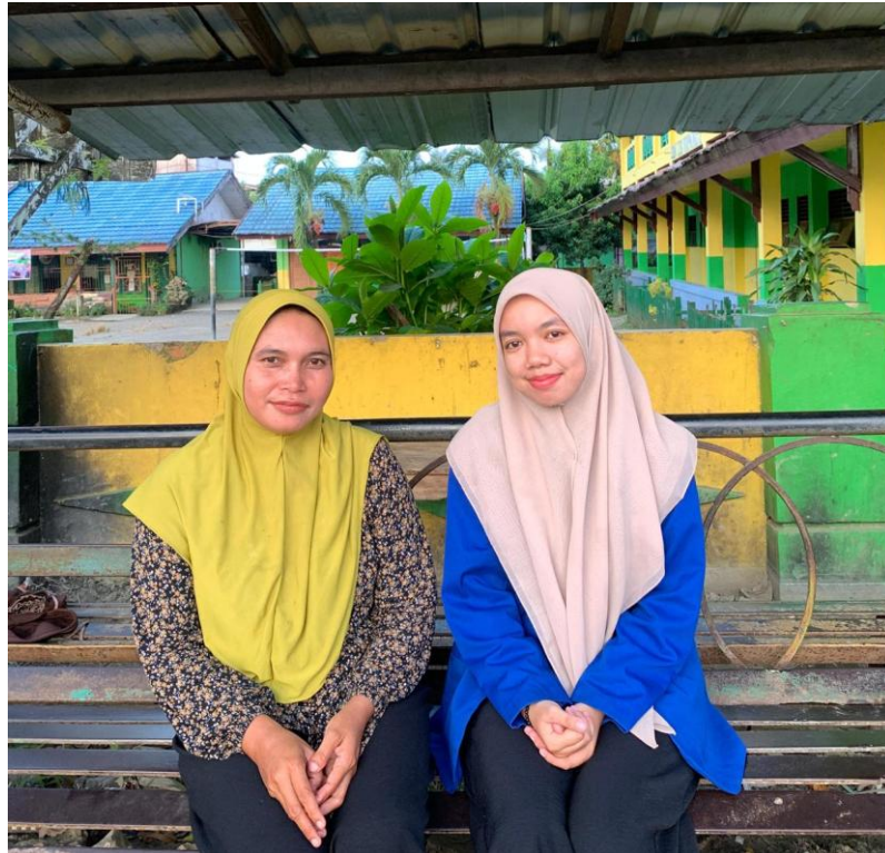
Gambar 5 Wawancara dengan Masyarakat