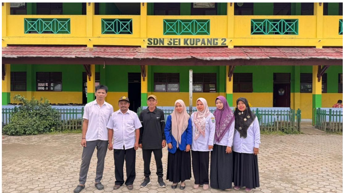
Gambar 6 Foto bersama