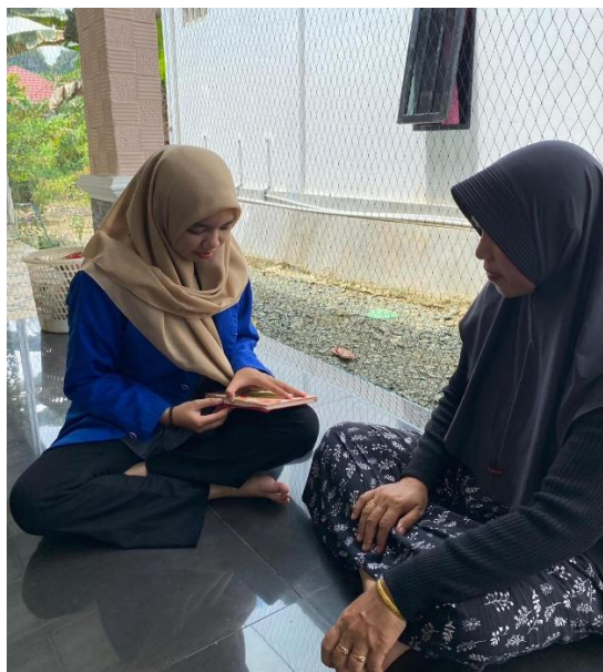
Gambar 4 Wawancara dengan Orangtua Siswa