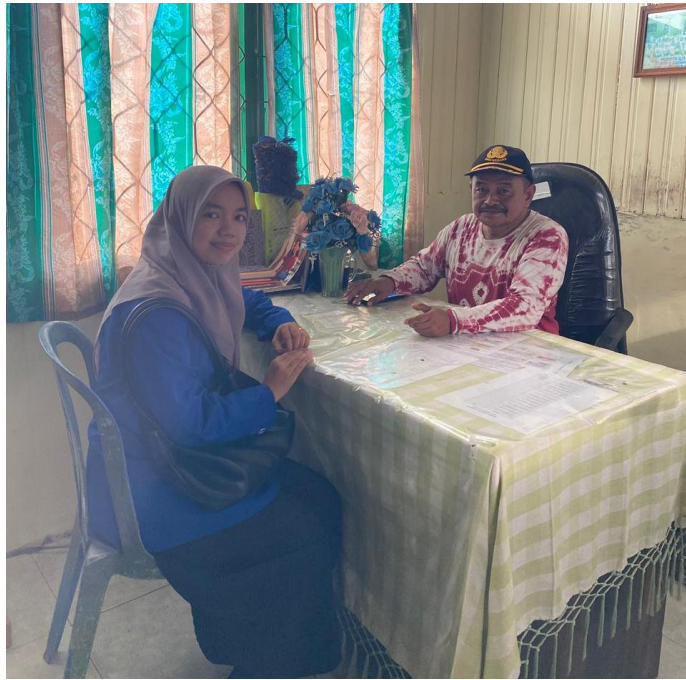
Gambar 1 Wawancara dengan Kepala SDN 2 Sungai Kupang