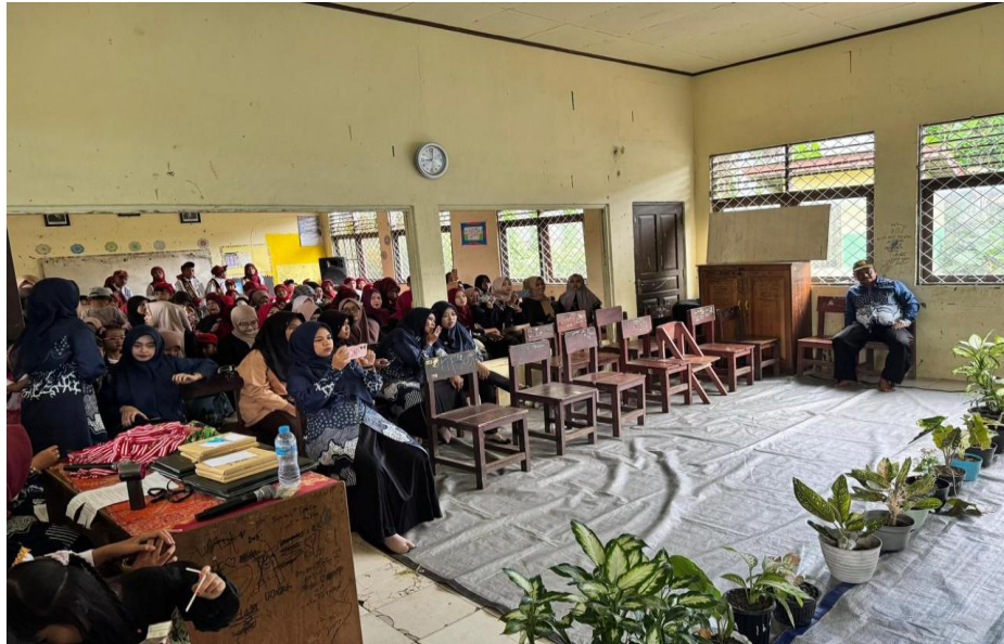
Gambar 8 Rapat Sekaligus Acara Perpisahan