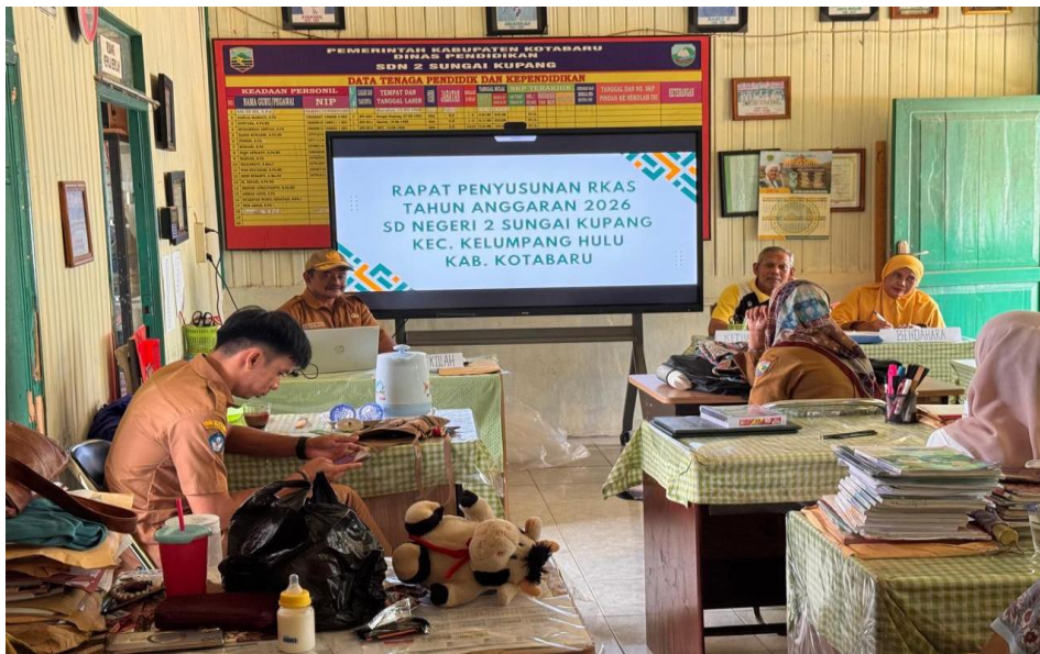
Gambar 7 Rapat Penyusunan RKAS