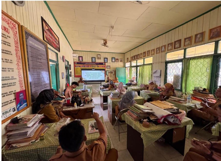
Gambar 6 Rapat Kegiatan Penyusunan RKAS