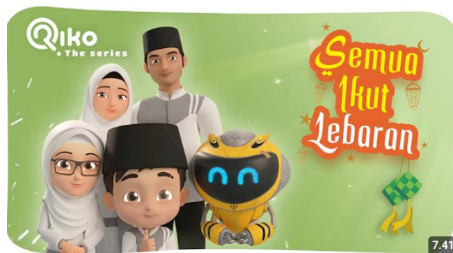
SEMUA IKUT LEBARAN - Riko The Series Season 03 - Episode 03