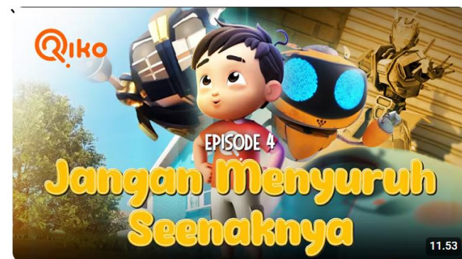
JANGAN MENYURUH SEENAKNYA - Riko The Series Season 05 - Episode 04