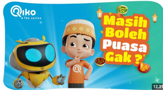
MASIH BOLEH PUASA NGGAK? - Riko The Series Season 03 - Episode 02