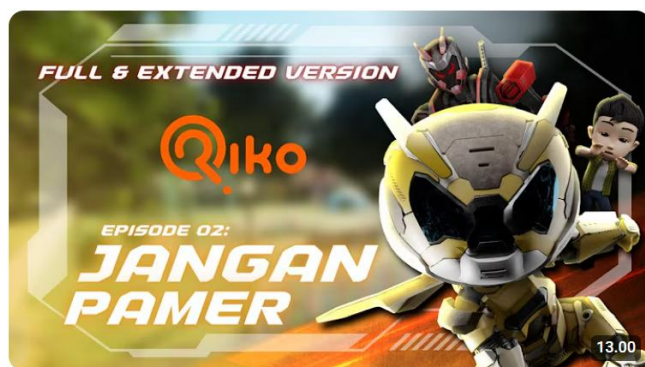
JANGAN PAMER - Riko The Series Season 04 - Episode 02