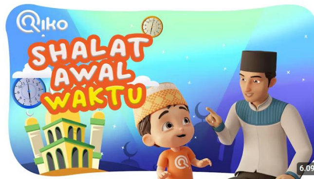
SHOLAT AWAL WAKTU - Riko The Series Season 03 - Episode 08