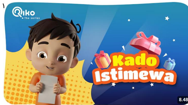
KADO ISTIMEWA - Riko The Series Season 03 - Episode 01