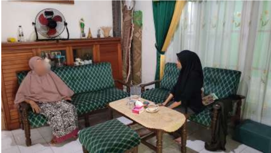
Dok. Informan Istri Pewaris