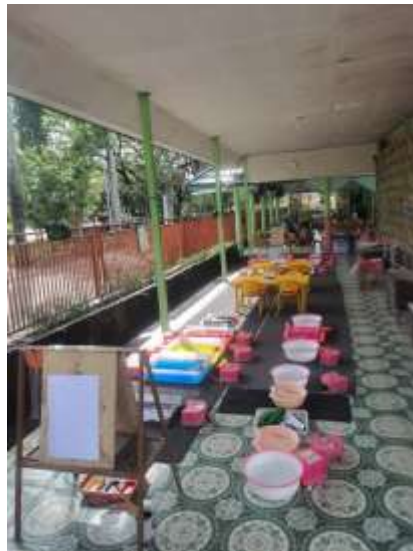
Gambar 4. 11 Aturan bermain sentra Peran Kecil

Pada kegiatan ini, guru melakukan penataan lingkungan main yang mana guru menata semua alat dan bahan main untuk anak. Jumlah tempat main dan waktu main direncanakan dengan cermat oleh guru. Dalam 1 kelas sentra, terdapat 8-10 anak yang mana biasanya ada 8-10 tempat main yang disediakan oleh guru sehingga semua anak mempunyai beberapa pilihan dan terhindar dari pertengkarannya soal mainan atau tempat.