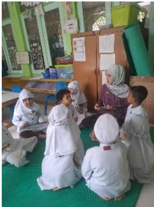
Gambar 4. 8 Guru menjelaskan rangkaian waktu main

Selanjutnya adalah guru menjelaskan tentang waktu saat bermain. Guru memberitahukan bahwa anak akan diberi kesempatan untuk memilih kegiatan main di sentra yang telah disiapkan. Guru menekankan bahwa saat bermain, anak boleh bereksplorasi, mencoba, dan berinteraksi dengan teman, namun tetap harus mengikuti aturan yang sudah disepakati. (OPAMSS 1.5) 56