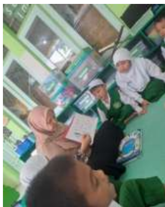
Gambar 4. 3 Guru mengenalkan kosakata baru

Pada saat ini, guru menggabungkan pengenalan kosakata baru dengan penjelasan konsep-konsep dasar yang berkaitan dengan tema dan keterampilan kerja anak sebelum kegiatan bermain dimulai. Guru memperkenalkan kata-kata baru yang relevan dengan tema yang akan