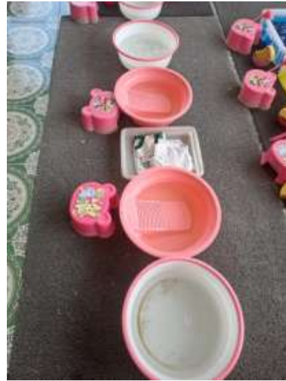
Gambar 4. 10 Aturan bermain sentra Peran Kecil

Pada sentra bahan alam, terlihat kursi-kursi yang diletakkan pada setiap permainan. Dengan adanya pembagian posisi duduk disekita wadah, anak secara tidak langsung diarahkan untuk berinteraksi dengan teman sekitarnya. Anak memiliki peluang untuk saling berkomunikasi, seperti bicara, bertanya, maupun bekerja sama dalam mengambil dan menuang air. Selain itu, penggunaan alat yang sama dalam satu area juga mendorong anak untuk belajar berbagi dan menunggu giliran saat bermain. (OPAMSBA 1.6) 57