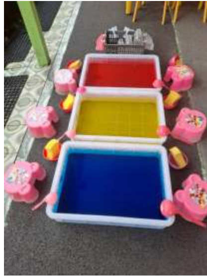
Gambar 4. 9 Aturan bermain sentra Peran Kecil