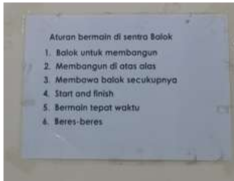
Gambar 4. 6 Aturan bermain sentra Balok

kelancaran dan keberhasilan mereka dalam main baik main sendiri maupun main bersama teman. Aturan yang dibuat juga berdasarkan penekanan tujuan pembelajaran di setiap sentra.