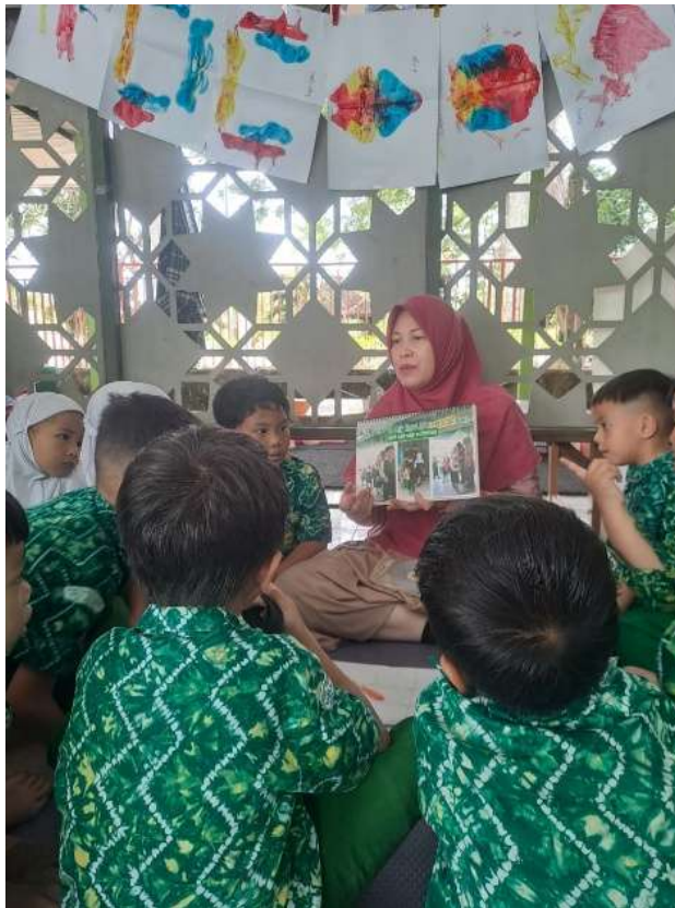
Gambar 4. 2 Sarana dan Prasarana (APE Outdoor) PAUD Terpadu Islam Sabilal Muhtadin Banjarmasin

Memasuki pijakan, guru memperlihatkan sebuah buku berisi gambar-gambar kegiatan di PAUD Terpadu Islam Sabilal Muhtadin Banjarmasin, lalu guru membacakan cerita dengan intonasi yang ekspresif sambil memperlihatkan gambar-gambar tersebut. Guru sesekali berhenti untuk mengajukan pertanyaan sederhana, seperti menanyakan pengalaman anak yang serupa dengan cerita atau mengajak anak menceritakan kembali kejadian yang pernah mereka alami. Dalam interaksi ini membantu anak merasa dihargai, didengar, dan terlibat aktif dalam kegiatan. (OPAMSPB 1.4) 52