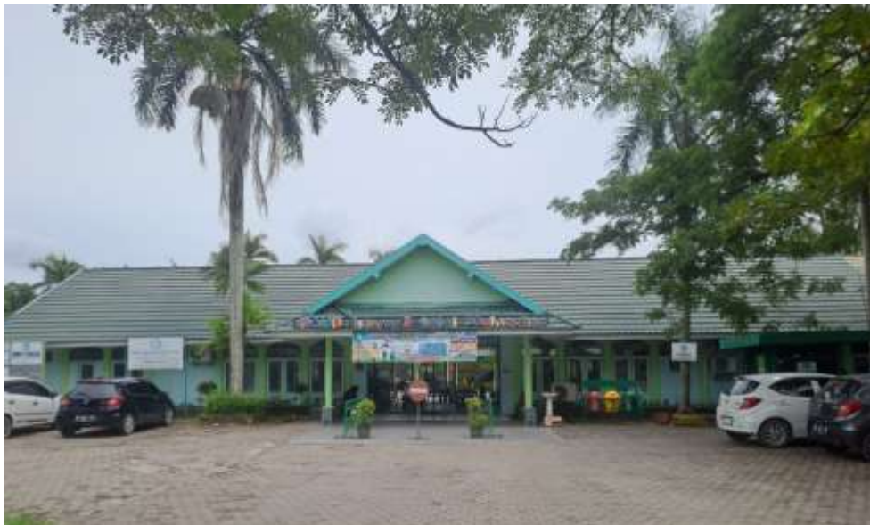
Gambar 4.1 Gedung PAUD Terpadu Islam Sabilal Muhtadin Banjarmasin (CDGDFS 2.1)

Sebelum peneliti menyajikan data tentang pijakan awal main di PAUD Islam Sabilal Muhtadin Banjarmasin, peneliti akan memberikan gambaran umum tentang lokasi penelitian. Berikut ini gambaran lokasi penelitian yang peneliti sajikan :