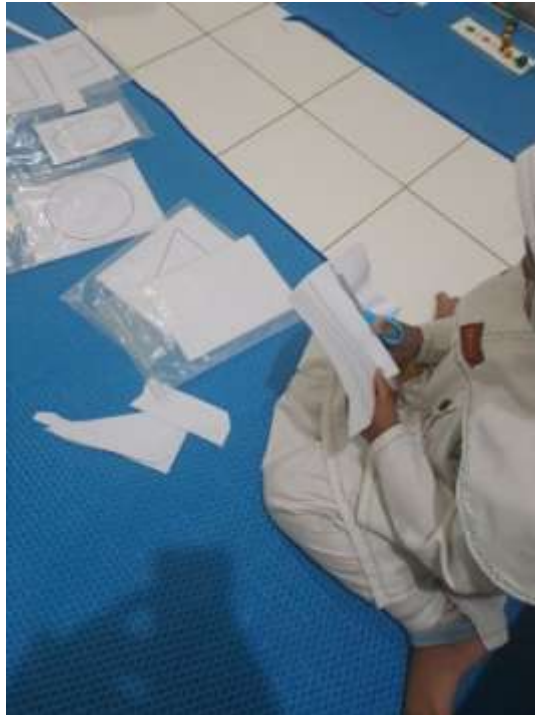
Gambar 4. 5 Anak menggunakan alat main

Guru menjelaskan tentang alat dan bahan main : nama, fungsi dan cara main. Memberikan contoh penggunaan bahan yang tepat dan penjelasan ringkas tetapi jelas tentang harapan guru dari anak adalah strategi penting untuk membantu kemandirian anak dalam penggunaan bahan.