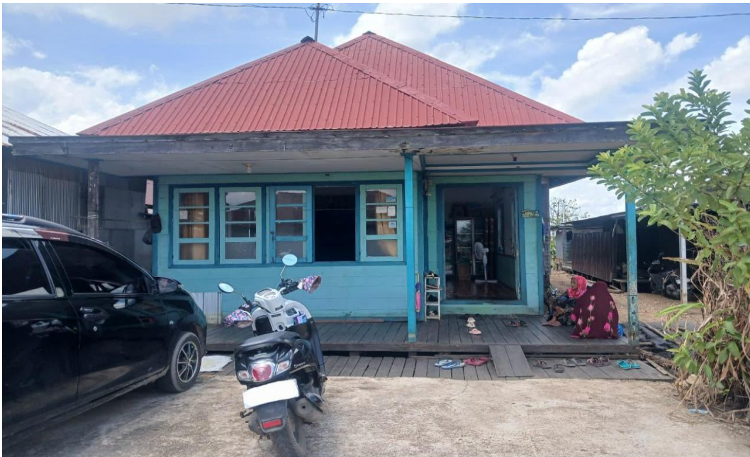
Gambar 4. 1 Tempat Penyuluhan Agama Islam Guru Ahmad Saukani (Pengajian Ibu-Ibu)

Lokasi penelitian bertempat di rumah ibu Hj. Bahjiah yang beralamat di Desa Tajau Landung Rt.002 Rw.000 Kecamatan Sungai Tabuk Kabupaten Banjar Provinsi Kalimantan Selatan. Untuk memberikan pemahaman yang lebih jelas mengenai lokasi penelitian maka akan disajikan gambaran umum sebagai berikut :