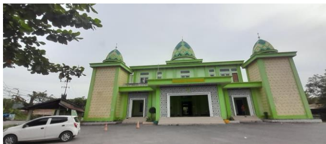
Gambar 4.2 Masjid Jami Sulaiman

Dengan visi dan misi tersebut, Masjid Jami' Sulaiman diharapkan dapat berfungsi secara optimal sebagai pusat ibadah, dakwah, dan pembinaan umat, serta mampu membangun kehidupan keagamaan yang lebih aktif, harmonis, dan berkelanjutan di lingkungan masyarakat Landasan Ulin Barat.