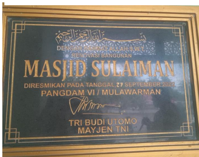
Gambar 4.4 Peresmian Masjid Jami Sulaiman