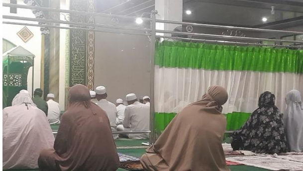
Gambar 4.3 Pengajian Rutinan