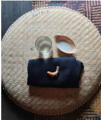
Gambar 4.1 Alat dan Bahan