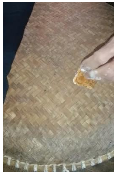
Gambar 4.3 Proses pencampuran bahan dalam ritual batatamba kapidaraan