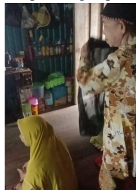
Gambar 4.6 Penggunaan kain hitam dalam proses penyembuhan