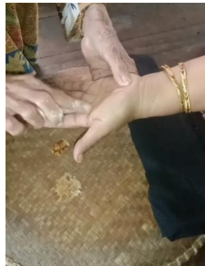
Gambar 4.4 Proses pengolesan ke telapak tangan pasien