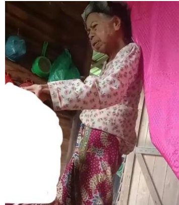
Gambar 4.2 Pembacaan Doa Pembuka