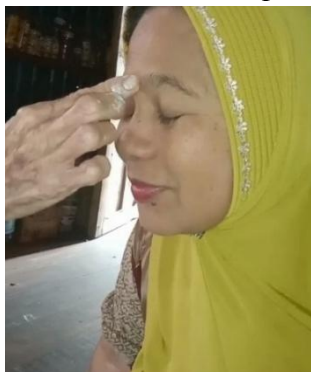
Gambar 4.5 Proses pengolesan ke tengah dahi pasien