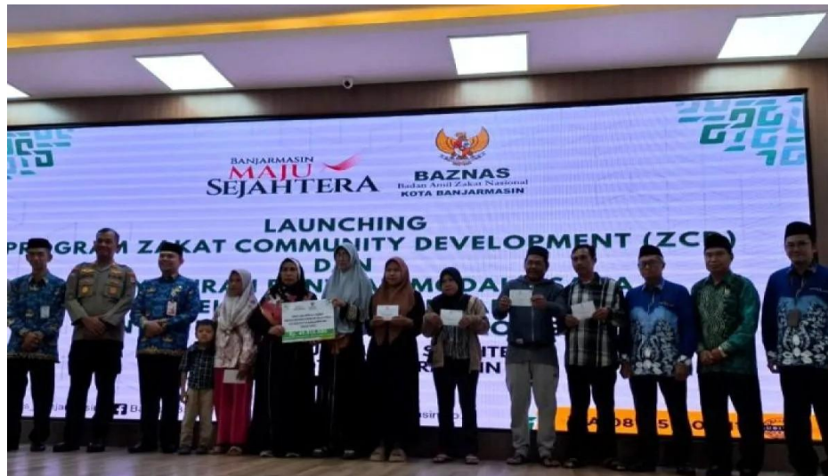
Gambar 4.4 Distribusi Program ZCD

asin difa mereka mendapatkan peralatan seperti kompor, tabung gas dan lain sebagainya.