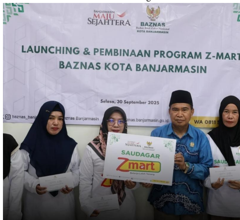
Gambar 4.6 Pembinaan Program Z-MART