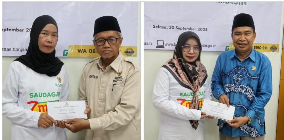
Gambar 4.3 Distribusi Program Z-MART