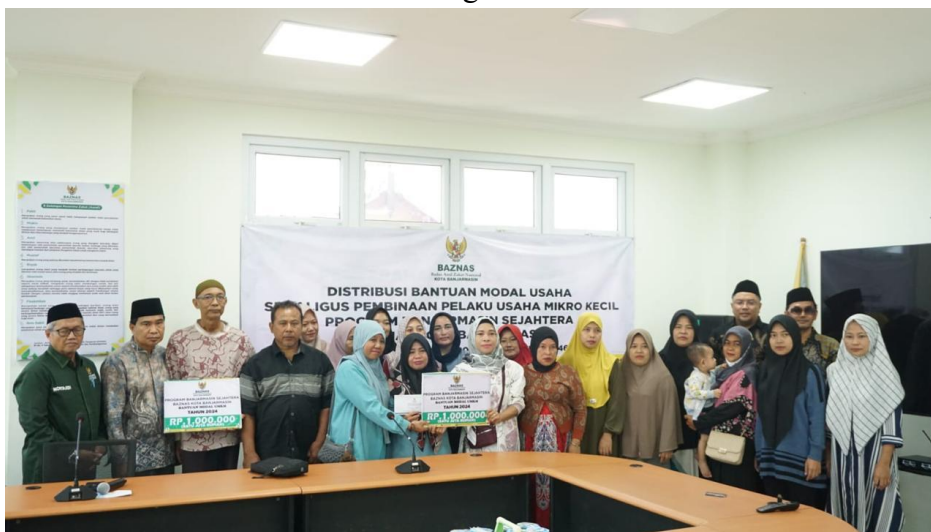
Gambar 4.2 Distribusi Program Bantuan Modal Usaha

“Saya menerima bantuan barang berupa lemari etalase kaca seharga Rp750.000 dan uang tunai Rp250.000 yang saya belikan juga untuk keperluan barang lainnya.” 10