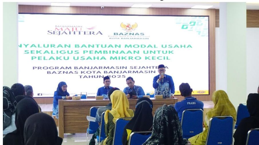
Gambar 4.5 Pembinaan Program BMU

Selain pembinaan di bidang keuangan, BAZNAS Kota Banjarmasin juga memberikan arahan terkait aspek non-keuangan, seperti penataan tempat usaha dan penentuan tema atau konsep usaha. Pembinaan ini bertujuan untuk meningkatkan daya tarik usaha sehingga mampu menarik lebih banyak konsumen. Penataan yang baik, baik dari segi kebersihan, kerapian, maupun estetika, dinilai dapat memberikan nilai tambah bagi usaha kecil yang dijalankan oleh mustahik.