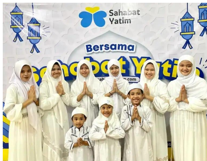
Gambar 1 Profile LAZNAS Sahabat Yatim Kota Banjarbaru