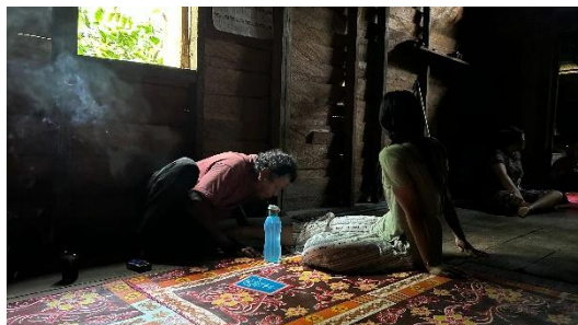
Gambar 4. 2 proses pengobatan menggunakan bacaan doa-doa dan media air

Di Desa Hingan Tokung, metode pengobatan tradisional sangat menekankan makna spiritual. Masyarakat memandang proses penyembuhan sebagai sesuatu yang terkait erat dengan aspek spiritual dan keagamaan. Pananamba menggunakan berbagai alat dan teknik, termasuk doa, membaca ayat-ayat dari Al-Quran, air yang di doakan, serta amalan doa-doa yang tidak terlepas dari manakib kisah kekeramatan para wali.