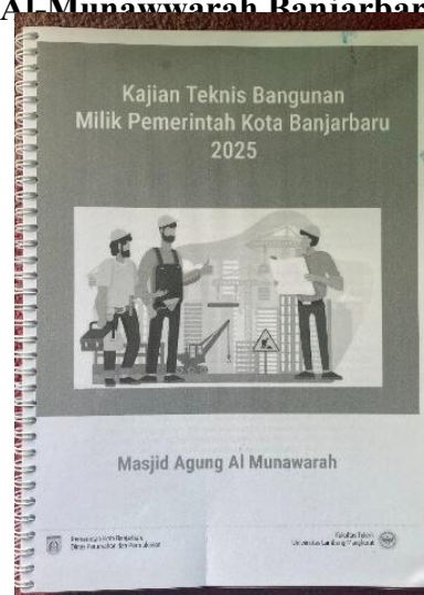
Gambar 4.3 Dokumen kajian teknis bangunan Masjid Agung Al-Munawwarah Banjarbaru

Kemarin itu sudah dibuat kajian oleh pemerintah kota melalui dinas perkim untuk mensyaratkan SLF, jadi nanti keluarlah hasil dari kajian itu. 6