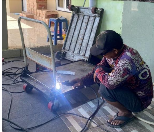
Gambar 4.8 Kegiatan perbaikan fasilitas masjid

memerlukan peralatan khusus atau tenaga teknis tertentu, maka pihak pengelola akan menggunakan tenaga teknis untuk melakukan perbaikan tersebut.