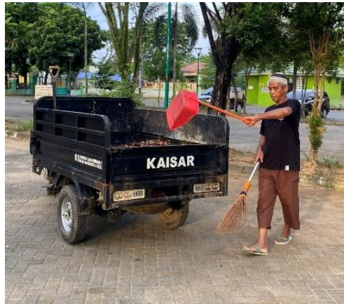
Gambar 4.5 Kegiatan Membersihkan Halaman Masjid