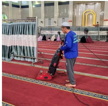
Gambar 4.6 Kegiatan Membersihkan Karpets Masjid Menggunakan Vacuum Cleaner

Selain kebersihan halaman masjid, kegiatan riayah juga dilaksanakan pada area dalam bangunan masjid seperti ruang salat, teras, serta fasilitas pendukung lainnya. Pembersihan dilakukan secara berkala untuk memastikan kebersihan lantai dan area sekitar tetap terjaga sebelum pelaksanaan salat berjemaah.