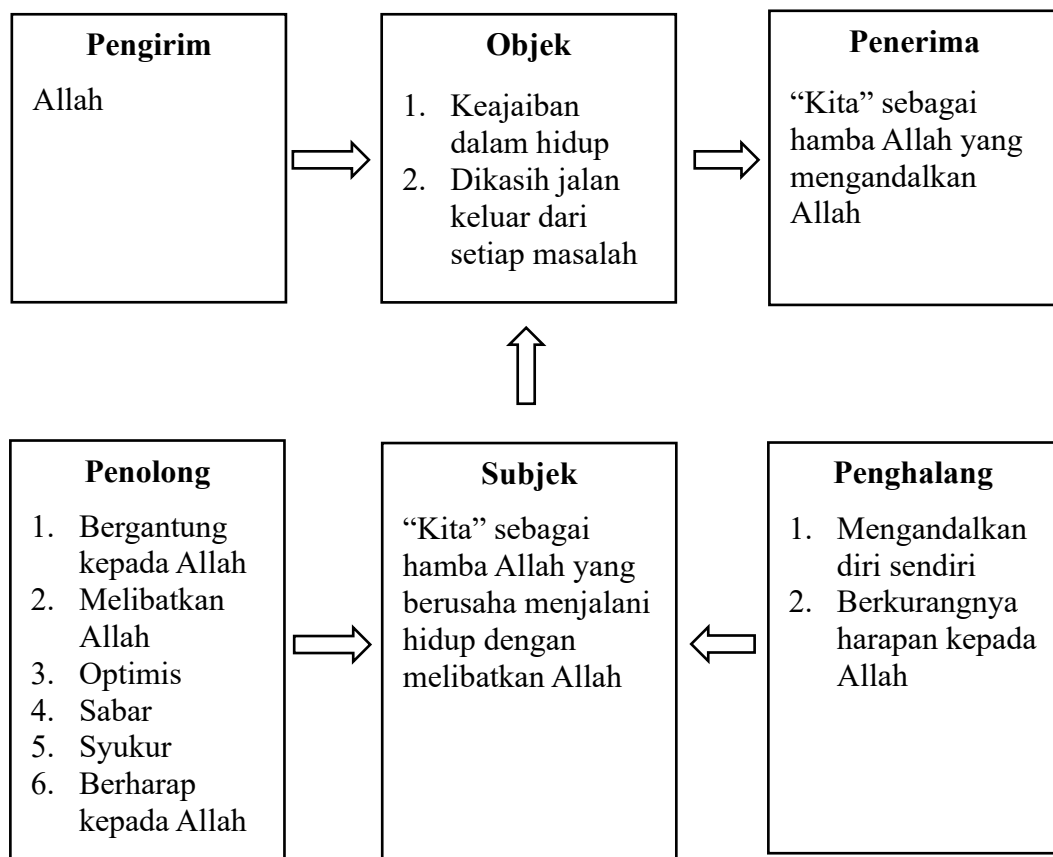
Gambar 3. Skema Aktan dalam Ceramah Kalau Lagi Mentok Harus Gimana?

Berikut ini merupakan skema aktansial yang disajikan untuk mempermudah pemahaman terhadap struktur naratif yang terkandung dalam ceramah berjudul Kalau Lagi Mentok Harus Gimana?