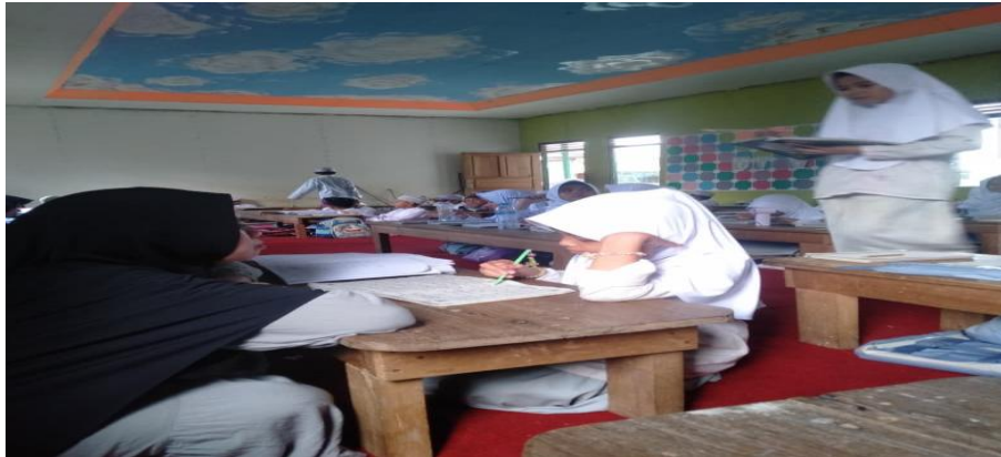
Kegiatan Bimbingan Agama Islam