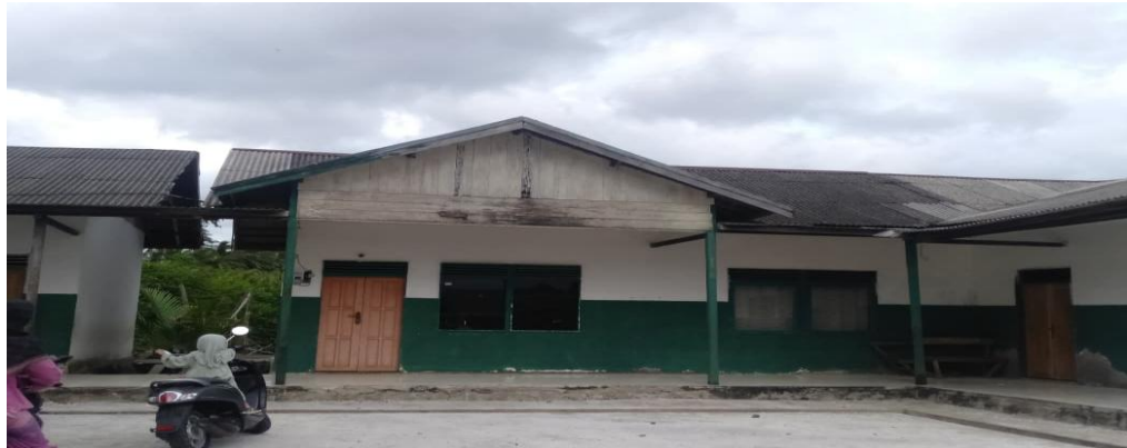
Kantor Pondok Pesantren Miftahussalam