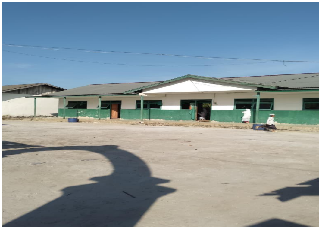
Halaman Pondok Pesantren Miftahussalam