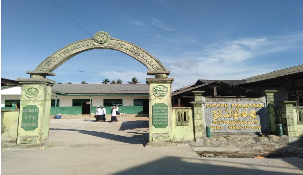
Pintu Gerbang Pondok Pesantren Miftahussalam