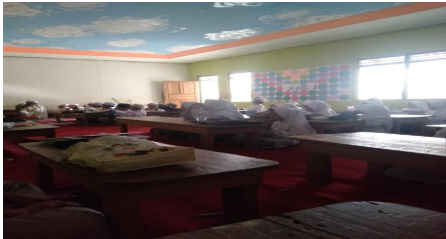
Kegiatan Bimbingan Agama Islam