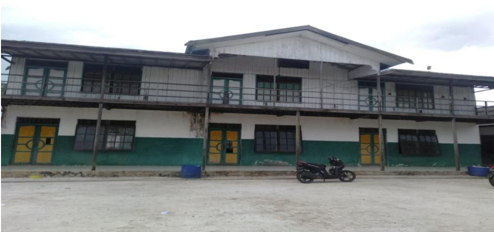
Kelas Tsanawiyah Pondok Pesantren Miftahussalam