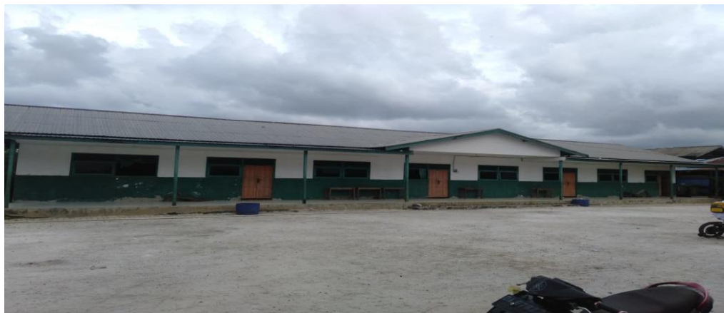
Kelas Ibtidaiyah Pondok Pesantren Miftahussalam