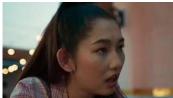
Gambar A.2.b.6) Profil Manda