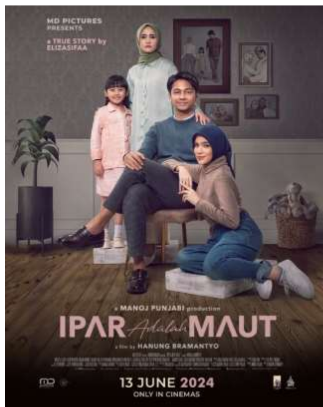
Gambar A.2 Poster Film “ Ipar Adalah Maut ”

menjadikan film sebagai subjek wacana di berbagai platform media sosial. Karya sinematik Ipar Adalah Maut melampaui tontonan belaka, berfungsi sebagai refleksi sosial tentang keragu-raguan hubungan keluarga ketika tidak dipelihara melalui prinsip-prinsip etika, komunikasi yang efektif, dan batas-batas yang terdefinisi dengan baik. Apa yang dimulai sebagai narasi langsung di TikTok kini telah berubah menjadi lambang peringatan bagi banyak rumah tangga Indonesia. 5