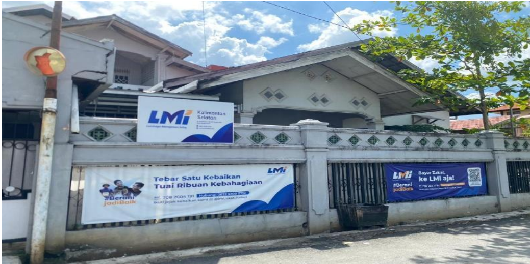
Gambar 0.2 Kantor LMI Kalimantan Selatan