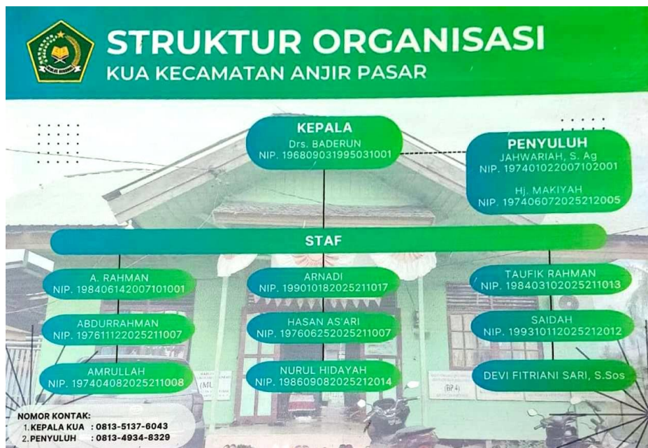
Gambar 4. 2 Struktur Organisasi KUA Kecamatan Anjir Pasar