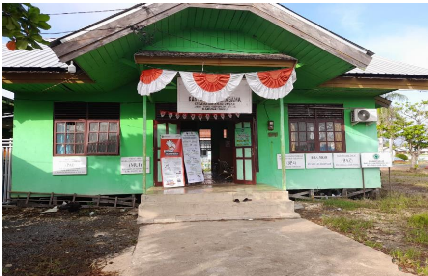
Gambar 4.1 Kantor Urusan Agama Kecamatan Anjir Pasar

KUA Kecamatan Anjir Pasar didirikan sejak tahun 1996 guna mendukung KUA Anjir Muara untuk menjalankan berbagai kegiatan yang ada di KUA. Sebelum itu hanya terdapat satu Kantor Urusan Agama yang beroperasi baik Anjir Muara maupun Anjir Pasar. Dengan hadirnya KUA Anjir Pasar, diharapkan dapat menyediakan pelayanan kepada masyarakat agar lebih optimal dan lebih mudah diakses, sehubungan dengan luasnya wilayah kecamatan tersebut.