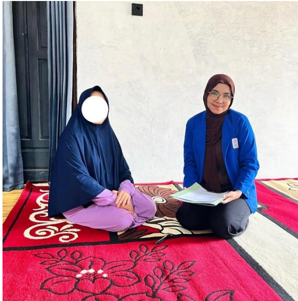
Gambar 3 Wawancara dengan Ibu IN (16 Februari 2026)