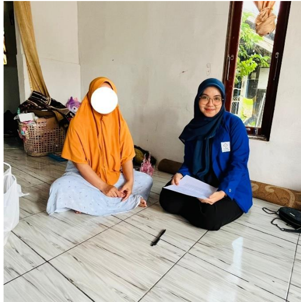
Gambar 5 Wawancara dengan Ibu RI (22 Februari 2026)