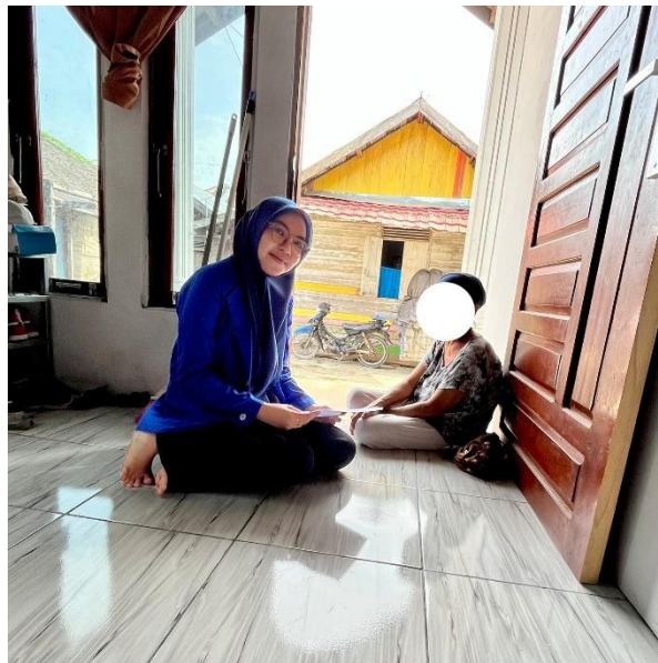
Gambar 6 Wawancara dengan Ibu RS (22 Februari 2026)