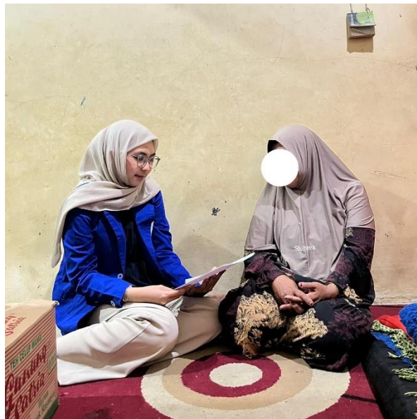
Gambar 2 Wawancara dengan Ibu RM (28 Februari 2026)