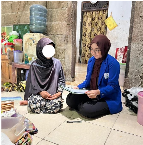
Gambar 4 Wawancara dengan Ibu F (16 Februari 2026)