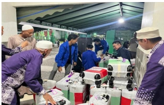
Gambar 4.10 Mahasiswa Membantu Menyusun Koper Jemaah

Hasil wawancara diatas terungkap bahwa ketika berkomunikasi dengan jemaah lansia atau jemaah yang mengalami kesulitan mahasiswa menggunakan bahasa yang lembut dan berbicara secara perlahan agar mudah dipahami. Terlihat ketika mahasiswa melayani jemaah, mereka berbicara dengan ramah, sopan disertai senyum. Pendekatan ini membuat komunikasi lebih hangat dan tidak kaku sehingga jemaah tidak merasa segan untuk bertanya ataupun meminta bantuan kepada mahasiswa.