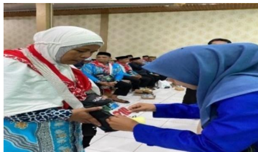
Gambar 4.4 Mahasiswa Menyerahkan Paspor Jemaah

Berdasarkan hasil wawancara tersebut bahwa sebelum kedatangan jemaah dilakukan briefing untuk memastikan seluruh kebutuhan pelayanan telah siap dan meminimalisir terjadinya kesalahan. Pada saat pembagian dokumen mahasiswa juga melakukan pengecekan ulang dengan menanyakan kepada jemaah terkait kesesuaian identitas paspor guna menghindari kesalahan.