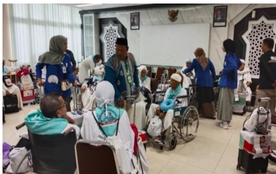
Gambar 4.9 Mahasiswa Masih dalam Pengawasan Petugas Haji

bimbingan tersebut. Koordinasi dan supervisi dilakukan secara langsung di lapangan untuk menghindari kesalahan prosedur terutama dalam hal administrasi dokumen, pendampingan lansia serta pengaturan alur pelayanan jemaah.