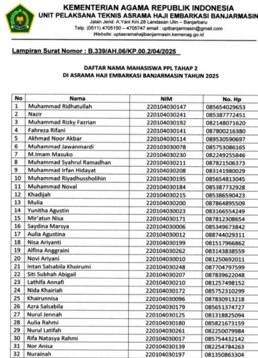
Gambar 4.5 Daftar Nama Mahasiswa Magang di Asrama Haji