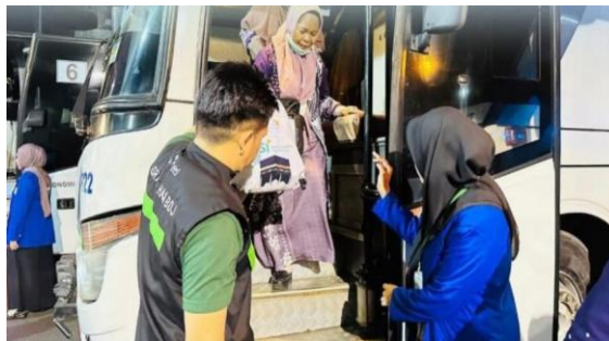
Gambar 4.8 Mahasiswa Membantu Jemaah Turun dari Bus

Hasil pengamatan peneliti pun menunjukkan bahwa mahasiswa memang hadir lebih awal sebelum jemaah datang dan telah stand by diposisi masing-masing, baik saat masa keberangkatan maupun pemulangan jemaah. Kehadiran lebih awal ini membuat proses penyambutan dan pelayanan kepada jemaah haji berjalan tertib dan lancar.