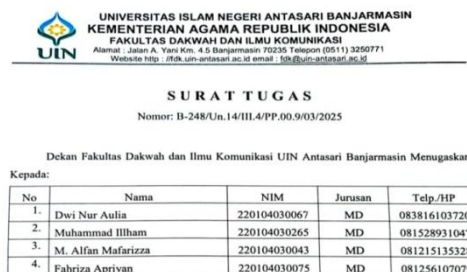
Gambar 4.6 Daftar Nama Mahasiswa Magang di Asrama Haji

Untuk melaksanakan Praktik Pengalaman Lapangan (PPL) yang dimulai dari tanggal 8 April s/d 31 Mei 2025 bertempat di Asrama Haji Embarkasi Banjarmasin, Jalan A. Yani KM 28 Landasan Ulin Banjarbaru. Setelah selesai melaksanakan tugas ini, segera membuat laporan untuk dilaporkan kepada Panitia PPL.