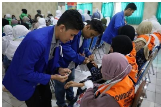
Gambar 4.7 Mahasiswa Membantu Memasangkan Gelang Jemaah