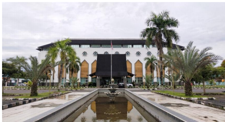
Gambar 4.1 UPT. Asrama Haji Embarkasi Banjarmasin