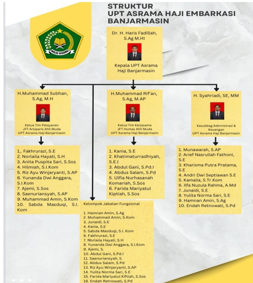
Tabel 4.1 Struktur Organisasi UPT. Asrama Haji Embarkasi Banjarmasin Periode 2025-2026.

Sumber: Dokumen UPT. Asrama Haji Embarkasi Banjarmasin