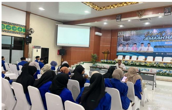
Gambar 4.2 Pembekalan Mahasiswa Magang Oleh Asrama Haji

kegiatan magang mahasiswa terlebih dahulu diberikan pembekalan mengenai prosedur pelayanan haji, pembagian tugas serta etika dalam berinteraksi dengan jemaah.