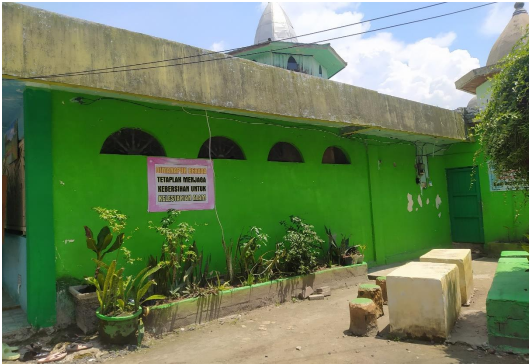
Foto tempat pelaksanaan kegiatan keagamaan