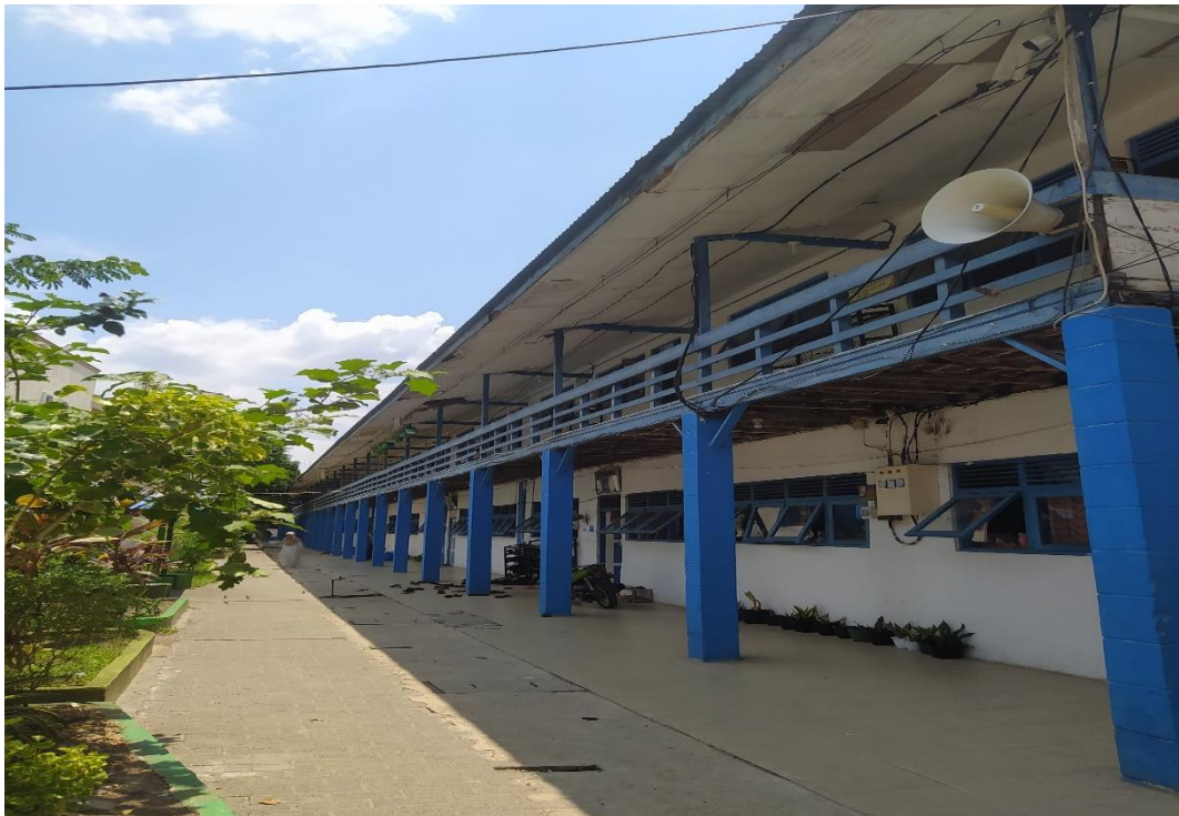
Foto asrama santriwati baru