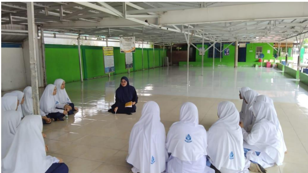
Foto kegiatan wawancara