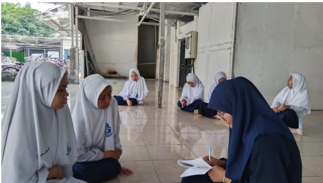
Foto wawancara dengan ketua asrama santriwati baru