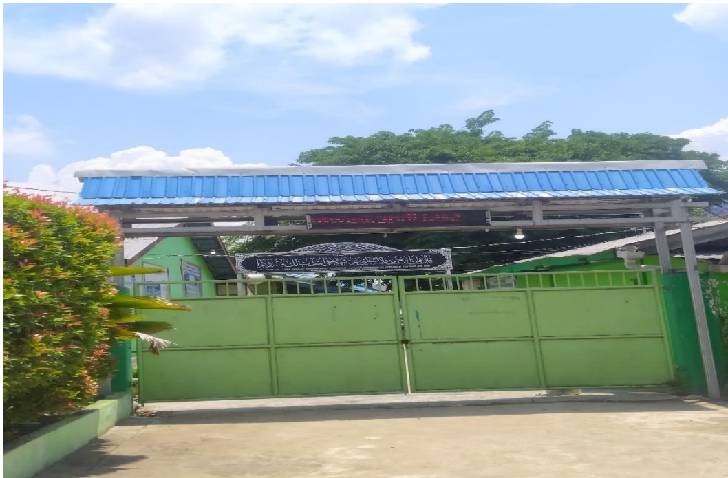
Foto gerbang masuk pondok pesantren