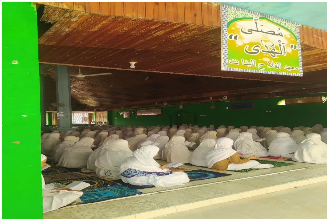
Foto kegiatan keagamaan