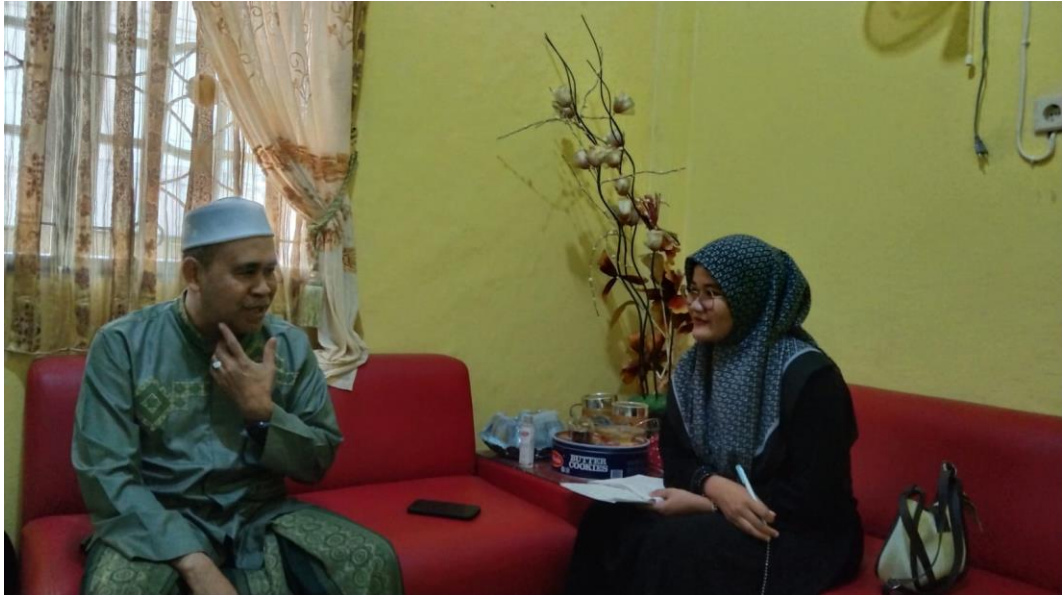
Foto wawancara dengan mudir/pimpinan pondok