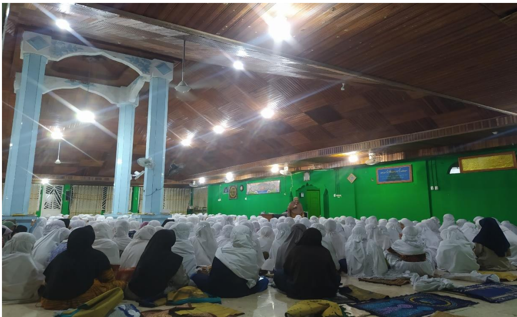
Foto kegiatan ceramah