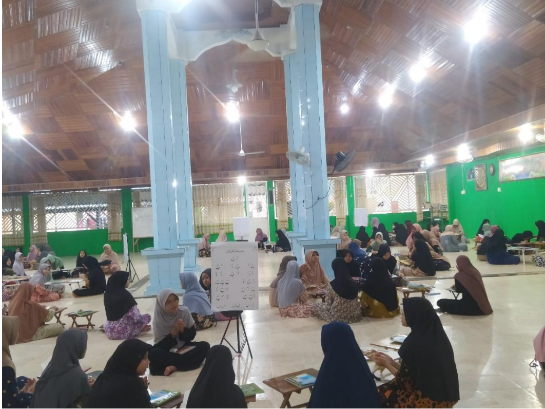
Foto kegiatan pembelajaran Al-Qur'an metode tilawati