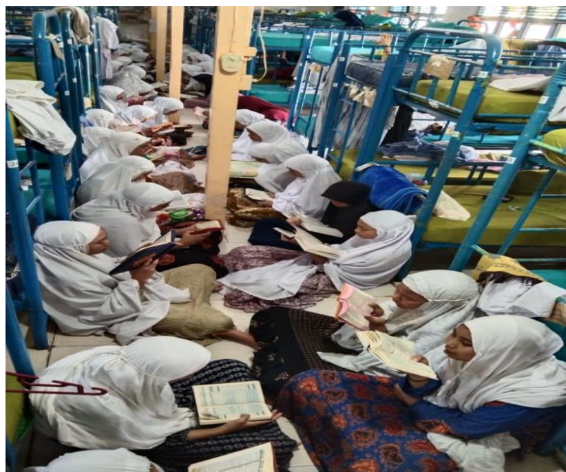
Foto kegiatan keagamaan