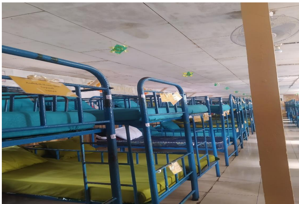
Foto tempat tidur santriwati baru