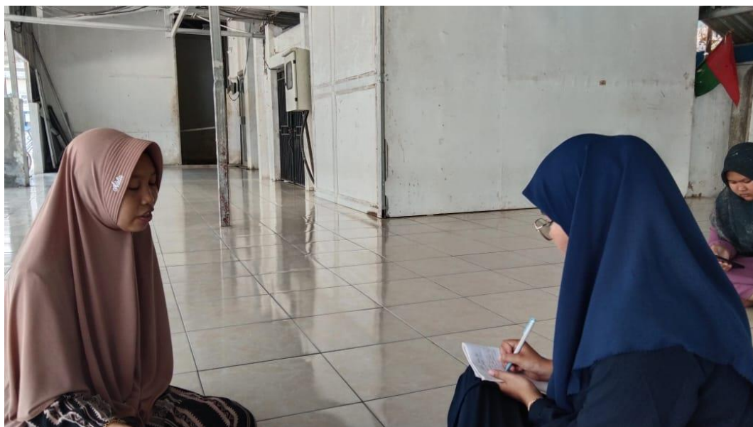
Foto wawancara dengan ibu asrama santriwati baru