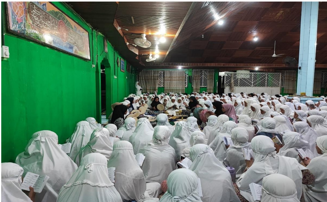
Foto kegiatan keagamaan