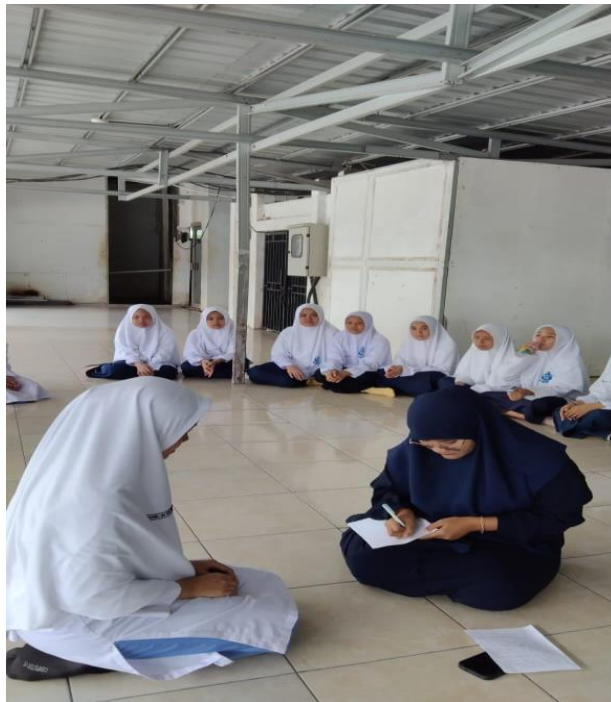
Foto wawancara dengan santriwati baru