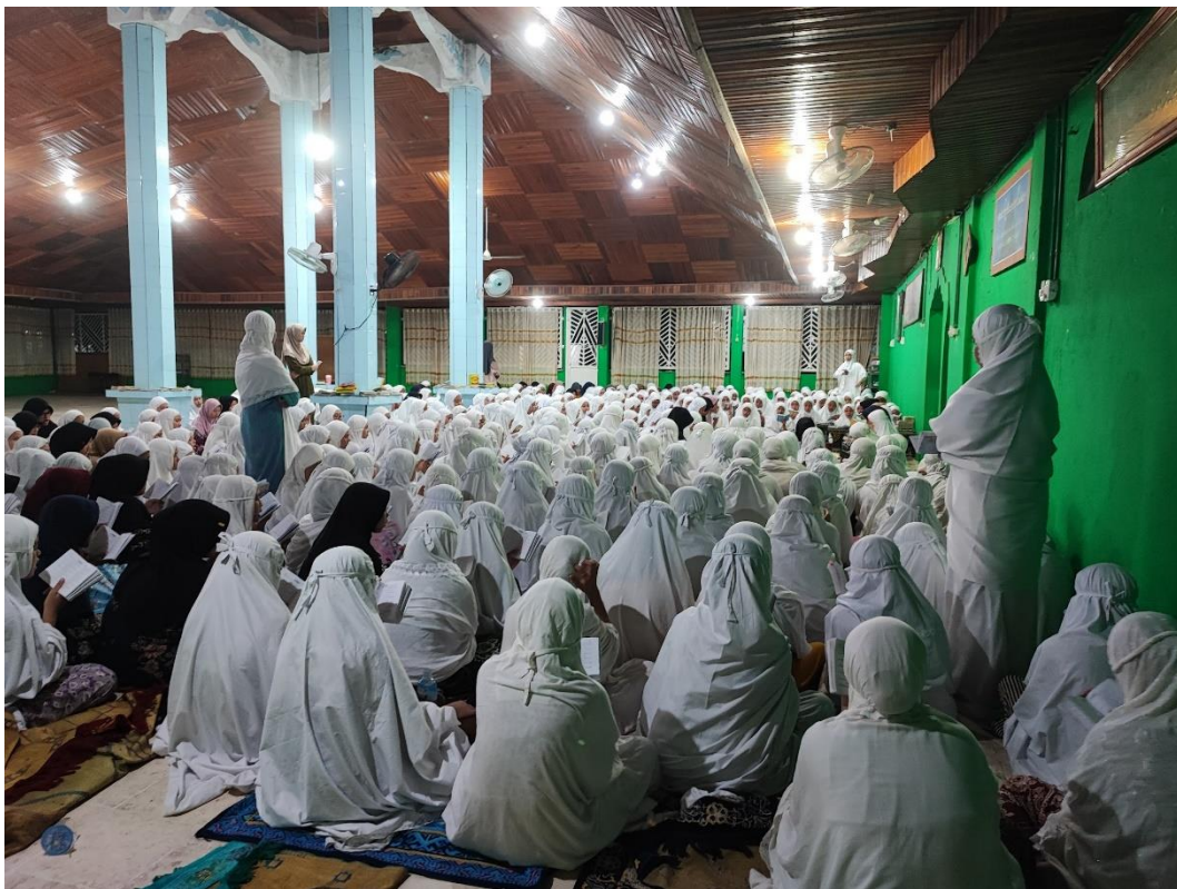
Foto kegiatan keagamaan