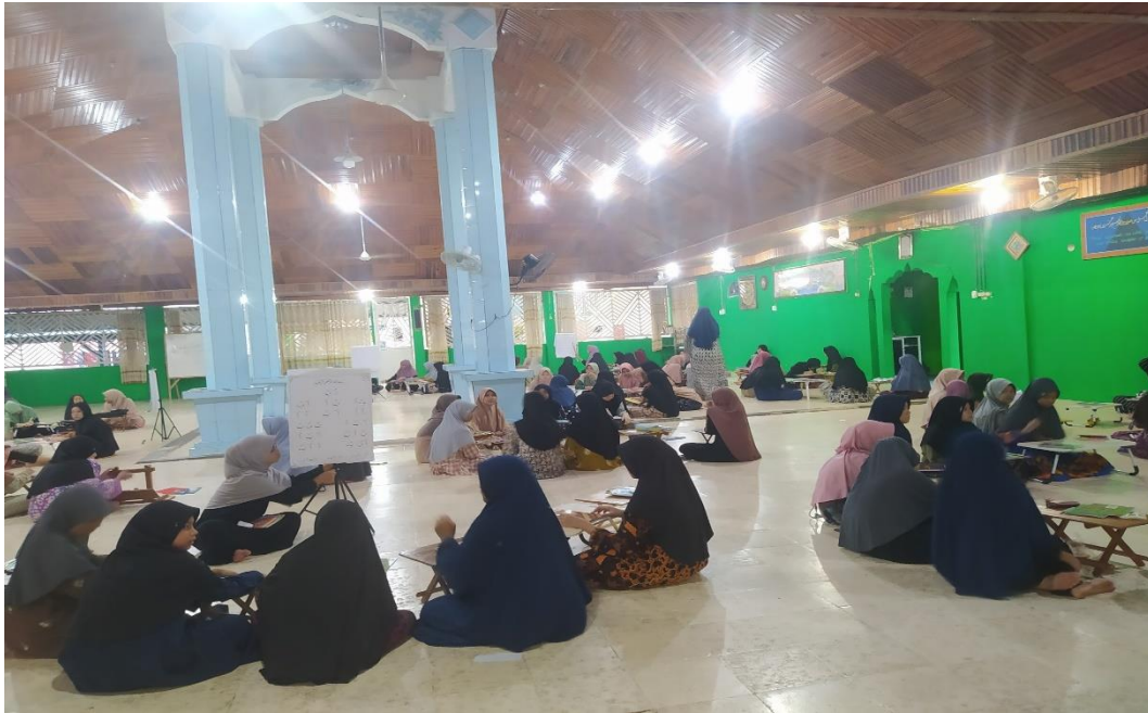
Foto kegiatan pembelajaran Al-Qur'an metode tilawati