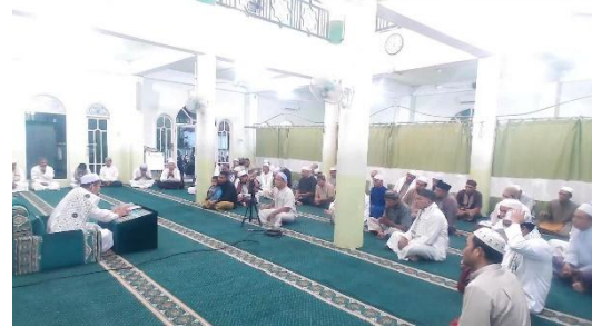
Pengajian Rutin Subuh Jum'at