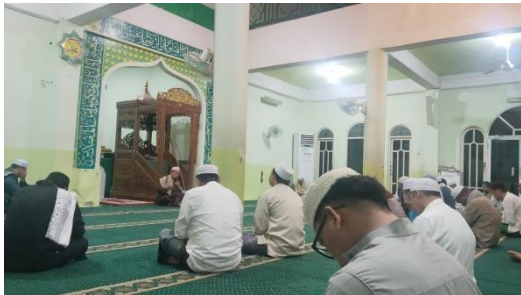
Pengajian Rutin Subuh Sabtu