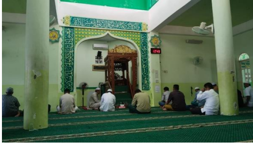
Kegiatan Sholat Zuhur Berjamaah