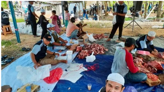
Penyembelihan Hewan Qurban