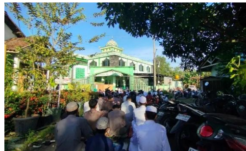
Sholat Idul Fitri Berjamaah