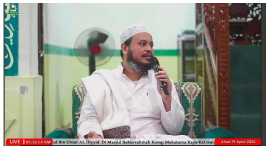
Pengajian Rutin Minggu Subuh