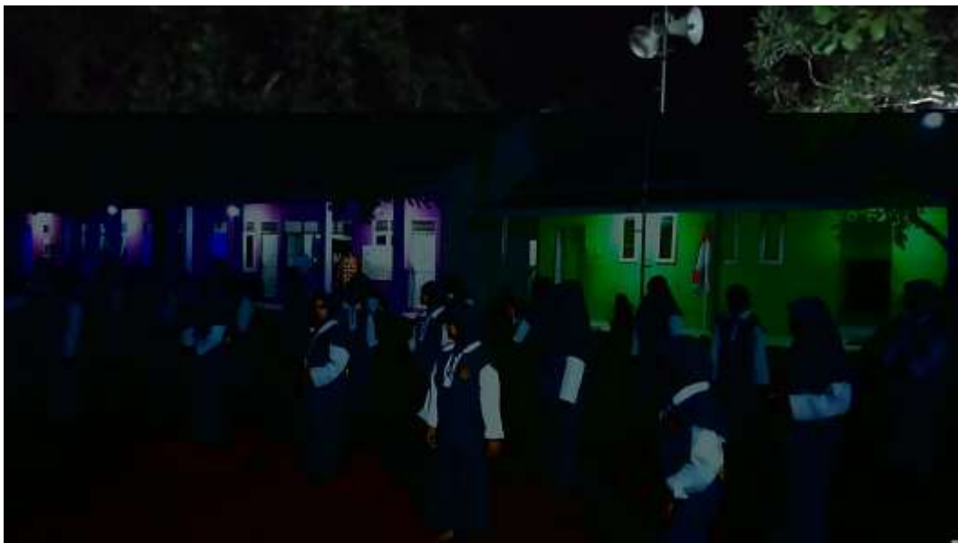
Gambar. 8. Kegiatan Santri Melakukan Pengisian 'Im al-asma'