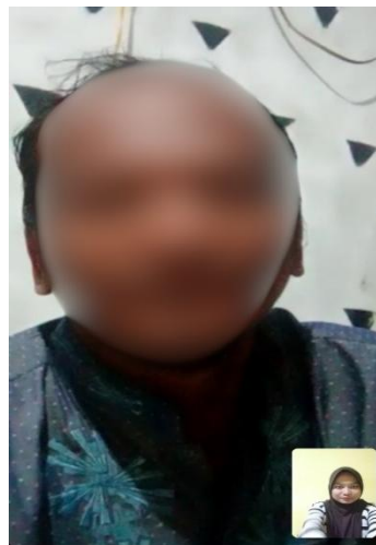
Dok. Informan II