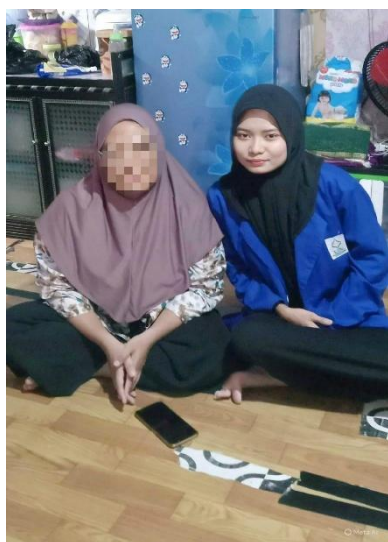
Dok. Informan III