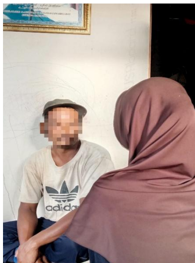
Dok. Informan I