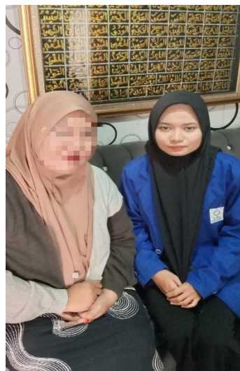
Dok. Informan IV