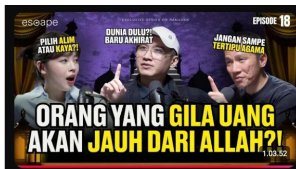
Gambar 4. 6 Konten Episode 18