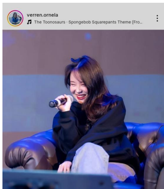
Gambar 4. 4 Verren Ornela

Verren Ornela merupakan seorang figur terkenal di platform media sosial dan pakar pemasaran digital asal Surabaya, Jawa Timur, Indonesia, ia semakin mendapatkan perhatian berkat kehadirannya di media sosial serta partisipasinya dalam beberapa podcast ternama. Selain kariernya, Verren juga dikenal aktif dalam menghasilkan konten media sosial yang menarik secara visual dan kaya akan informasi. Profil publiknya mengalami