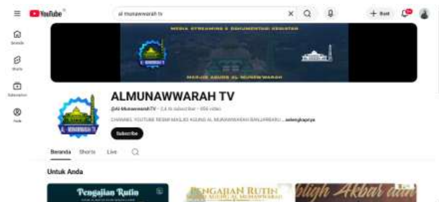
Gambar 4. 6 Channel YouTube Masjid Agung Al-Munawwarah Banjarbaru

penyebaran informasi serta dokumentasi kegiatan.