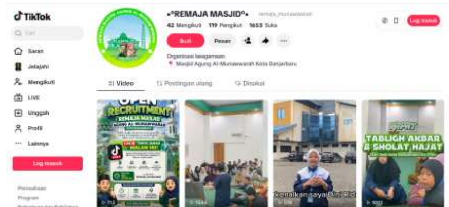
Gambar 4. 7 Akun Tiktok Remaja Masjid Agung Al-Munawwarah Banjarbaru

YouTube dengan nama akun @Al-MunawwarahTV platform yang digunakan saat siaran langsung pengajian rutin maupun event besar. Namun akun YouTube ini dikelola oleh pengurus masjid akan tetapi remaja masjid ikut dalam pengelolaannya.