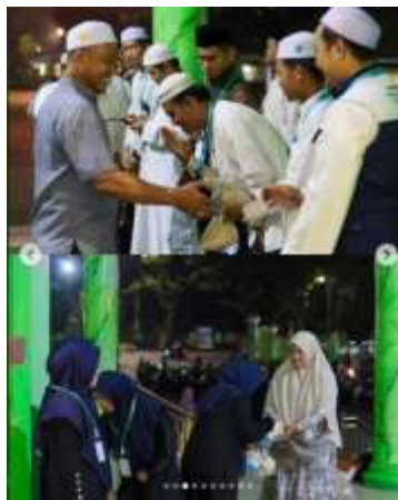
Gambar 4. 9 Bentuk Kesopanan Remaja Masjid Kepada Jamaah.

Meskipun lebih banyak mengandalkan media digital, mereka tetap menggunakan media fisik berupa banner untuk pengumuman acara besar, meskipun tidak menggunakan pamflet atau selebaran kertas. Pemilihan media ini juga didukung oleh masukan strategis dari pengurus masjid yang mendorong Remas agar terus mempublikasikan kegiatan melalui media sosial sehingga Masjid Agung Al-Munawwarah dapat menjadi contoh atau model bagi Remaja Masjid lainnya di Kota Banjarbaru.