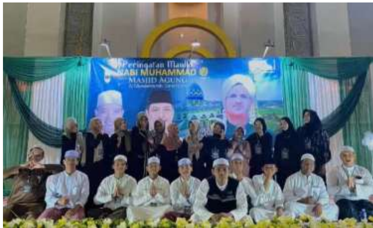
Gambar 4. 2 Remaja Masjid Agung Al-Munawwarah Banjarbaru

Remaja Masjid Masjid Agung Al-Munawwarah Banjarbaru merupakan salah satu kelompok pemuda yang aktif berperan dalam pelaksanaan dan pengembangan aktivitas keagamaan di lingkungan Masjid Agung Al-Munawwarah. Kelompok ini beranggotakan remaja dan pelajar yang berada di wilayah Kota Banjarbaru, Kalimantan Selatan, dengan rentang usia mulai