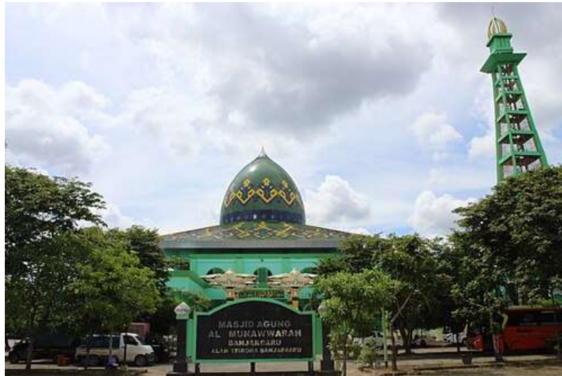
Gambar 4. 1 Masjid Agung Al-Munawwarah Banjarbaru

Masjid Agung Al-Munawwarah terletak di Jalan Trikora No. 9, Kelurahan Kemuning, Kecamatan Banjarbaru Selatan, Kota Banjarbaru, Provinsi Kalimantan Selatan. Letaknya yang berada di pusat kota menjadikan masjid ini mudah diakses oleh masyarakat dari berbagai wilayah. Posisi yang strategis tersebut mendukung fungsi masjid sebagai pusat kegiatan keagamaan dan sosial kemasyarakatan.