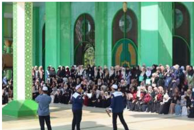
Gambar 4. 4 Kegiatan Pesantren Ramadhan oleh Remaja Masjid Agung Al-Munawwarah Banjarbaru

Berdasarkan analisis kondisi dan kebutuhan, serta masukan dari masyarakat, pengurus dan Remaja Masjid menyelenggarakan berbagai kegiatan keagamaan dan sosial. Salah satu kegiatan utama yang diidentifikasi adalah pesantren Ramadhan. Dibandingkan dengan kegiatan pesantren Ramadhan tahun lalu, partisipasi dari siswa dinilai lebih sedikit di tahun lalu.