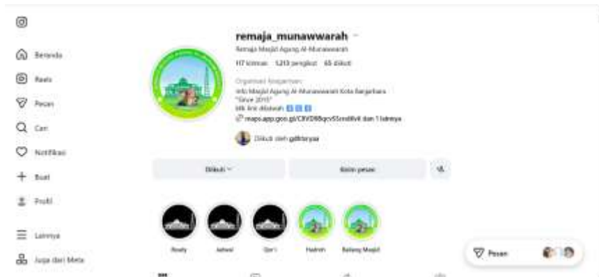
Gambar 4. 5 Akun Instagram Remaja Masjid

Instagram dengan akun @remaja_munawwarah sebagai media untuk menyebarkan informasi kegiatan serta dokumentasi kegiatan. Akun tersebut dikelola langsung oleh remaja masjid sebagai pusat