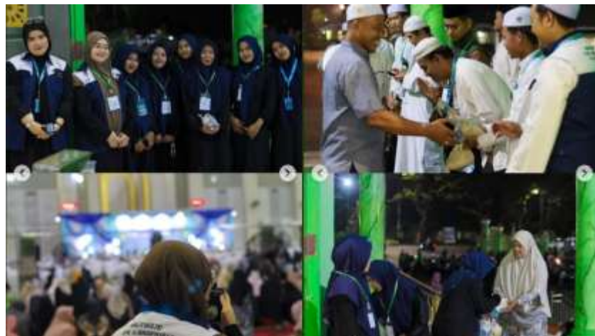
Gambar 4. 3 Remaja Masjid dalam Kegiatan Peringatan Hari Besar Islam Isra' Mi'raj. Sumber Instagram Remaja Masjid Agung Al-Munawwarah Banjarbaru

Bentuk apresiasi terhadap situasi ini tercermin dari adanya mekanisme penampungan masukan dari berbagai pihak, serta upaya mengidentifikasi berbagai kendala yang muncul selama pelaksanaan kegiatan. Hal ini dilakukan untuk melihat apa yang dibutuhkan oleh masyarakat sehingga akhirnya muncul kegiatan-kegiatan tertentu sebagai solusi atau respons.