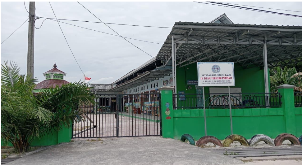
Gambar 4.1. Gedung TK IT Permata Kumai 47

TK IT Permata terletak di Jalan Berlian RT 16, Kelurahan Kumai Hilir, Kecamatan Kumai, Kabupaten Kotawaringin Barat, Kalimantan Tengah, berdiri sejak tanggal 05 Juli 2017, dan mulai beroperasi pada tahun ajaran 2019/2020. TK IT Permata Kumai dibawah naungan Yayasan Haji