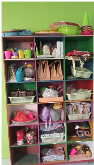
Gambar 4.7 Tempat penyimpanan bahan looseparts 82

bahan alami atau looseparts membutuhkan perhatian khusus dalam hal penyimpanan.