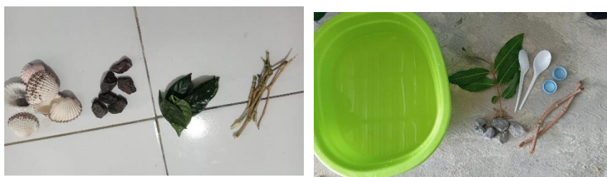
Gambar 4.6 Bahan alam yang ada di lingkungan sekitar 74

Faktor pendukung yang ketiga yaitu, lingkungan sekitar yang mendukung sebagai sumber belajar bagi anak usia dini. Lingkungan sekitar sekolah terdapat berbagai bahan alam yang dapat dimanfaatkan sebagai media pembelajaran. Dalam hal ini sesuai dengan pernyataan dari Bunda A bahwa, “Dari lingkungan sekitar sekolah juga sudah mendukung untuk bahan-bahan alam yang mudah untuk ditemui.” (CWGSBA.13) 72 Dalam pernyataan ini sesuai dengan yang disampaikan oleh kepala sekolah yaitu, Bunda L menyampaikan, “Biasanya untuk bahan di sekitar biasa kami gunakan tapi itu tergantung pada guru sentra bahan alam nya lagi apakah itu sesuai dengan kegiatan pembelajaran pada saat itu, karena di sekitar sekolah kita ini kan banyak bahan-bahan looseparts yang bisa kita gunakan untuk kegiatan pembelajaran.” (CWKS.9) 73 Lingkungan sangat berperan sebagai sumber belajar anak yang mudah ditemukan, namun harus sesuai dengan tema pembelajaran pada hari itu.