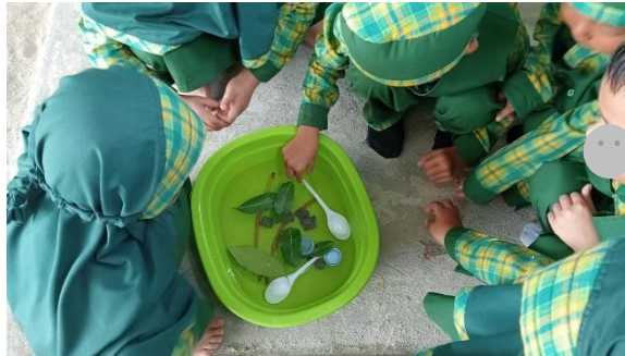
Gambar 4.3 Kegiatan pembelajaran eksperimen tenggelam dan mengapung 58

Berdasarkan data observasi tersebut, terlihat anak terlibat dalam kegiatan mencoba, mengamati, dan berinteraksi langsung dengan guru dan teman selama eksperimen berlangsung. Aktivitas ini menunjukkan munculnya pengalaman belajar sains yang bersifat langsung dan bermakna bagi anak. Selama kegiatan eksperimen berlangsung anak-anak lebih antusias dan terlibat secara aktif saat kegiatan eksperimen berlangsung. Bunda A juga menyampaikan, “Untuk respon anak mungkin mereka lebih antusias dan anak juga terlibat secara aktif sebagai pelaku dalam kegiatan eksperimen dan anak juga menunjukkan rasa ingin tahu yang sangat tinggi.”(CWGSBA.7) 59