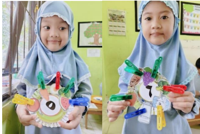
Gambar 4.26 Kegiatan Anak Mengisi Piring Makanan Sesuai Angka (CLFKP.5.7) 30