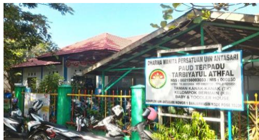
Gambar 4.1 Depan Gedung PAUD Tarbiyatul Athfal Banjarmasin

PAUD Terpadu Tarbiyatul Athfal UIN Antasari Banjarmasin merupakan unit Pendidikan anak usia dini di bawah naungan Yayasan Dharma Wanita Persatuan UIN Antasari, di dirikan pada tahun 1976. Lembaga ini berdiri sebagai bagian penting dari pengembangan Pendidikan awal bagi anak usia dini sebelum memasuki sekolah dasar, dan dikelola langsung oleh Yayasan yang berafiliasi dengan UIN Antasari Banjarmasin untuk memberikan stimulasi pendidikan sejak dini.