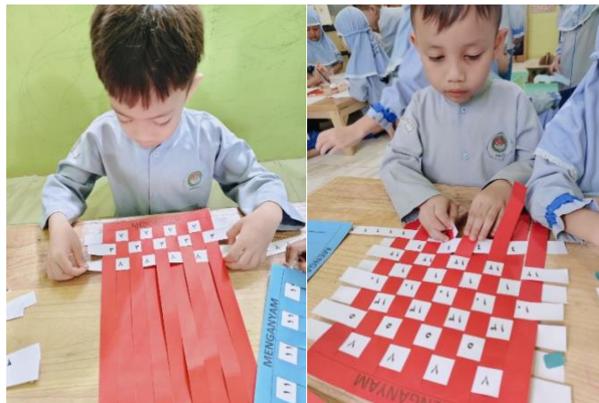
Gambar 4.23 Kegiatan Anak Menganyam Angka Hijaiyah (CLFKP.5.7) 27

Kegiatan main sensorimotor pada sentra imtaq terlihat pada aktivitas menganyam angka hijaiyah, mengurutkan huruf hijaiyah, dan menemukan huruf awal. Kegiatan ini melatih koordinasi tangan dan konsentrasi anak.