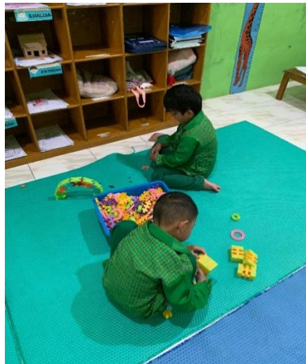
Gambar 4.8 Kegiatan Anak Bermain Lego (DLFKP.5.5) 12