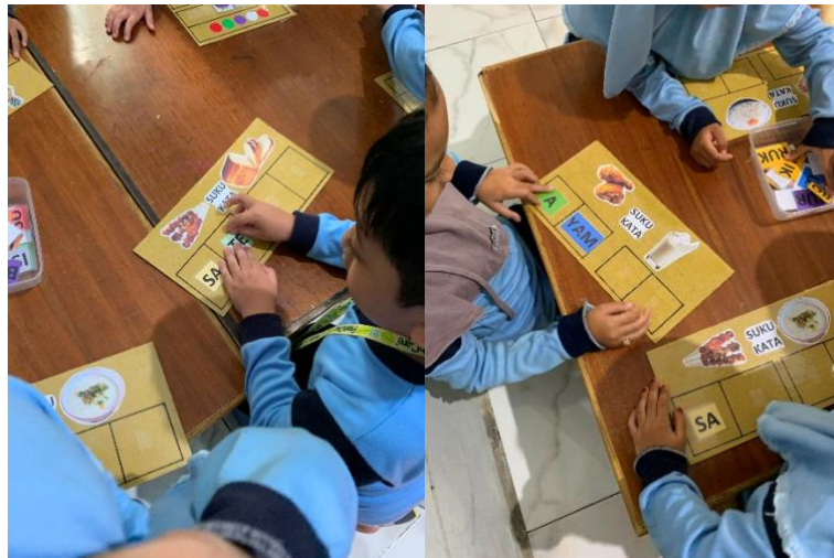
Gambar 4.31 Kegiatan Anak Mencocokkan Suku Kata (CLFKP.5.8) 35