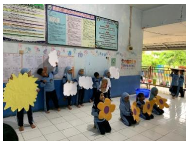
Gambar 4.9 Kegiatan Main Peran Pada Saat siang hari (CLFKP.5.5) 13

Pada saat anak bermain lego ini termasuk main konstruktif, karena terlihat saat anak menggunakan lego untuk membangun sesuatu sesuai imajinasi mereka.