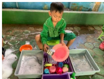
Gambar 4.19 Kegiatan Anak Bermain Mencuci Piring (CLFKP.5.6) 23

Kegiatan main peran pada sentra alam terlihat pada anak-anak berpura-pura melakukan aktivitas rumah tanggaseperti mencuci piring dan mencuci pakaian kegiatan ini membantu anak memahami kehidupan sehari-hari.