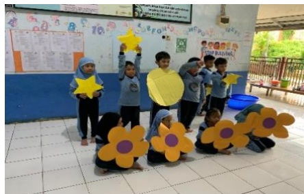
Gambar 4.10 Kegiatan Main Peran Pada Saat Malam Hari (CLFKP.5.5) 14

Pada pertemuan selanjutnya anak-anak bermain peran besar (Makro). Anak-anak berperan menjadi benda benda langit seperti, matahari, awan, bulan, bintang, pelangi, awan hujan, dan bunga. Kegiatan ini masuk ke kegiatan main peran, karena anak-anak berpura-pura menjadi benda-benda langit.