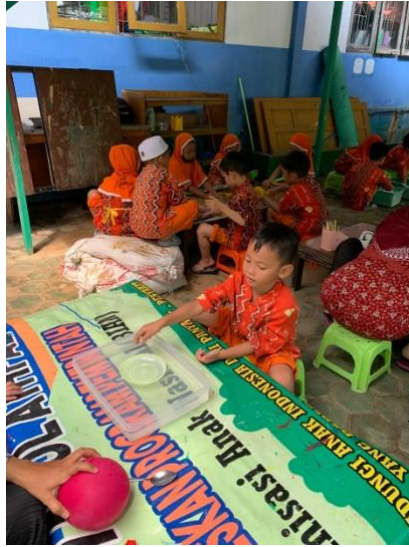
Gambar 4.15 Kegiatan Eksperimen Benda Terapung, Melayang, dan Tenggelam (CLFKP.5.6) 19