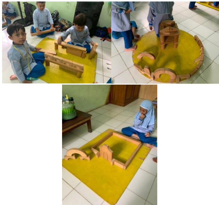
Gambar 4.4 Kegiatan membangun Benda-Benda Langit dari Balok (DLFKP.5.4) 8

Kegiatan main peran pada saat sentra balok terlihat pada saat anak mulai memberi makna pada hasil bangunannya, seperti berpura-pura rumah yang di buat adalah rumah tempat tinggal.