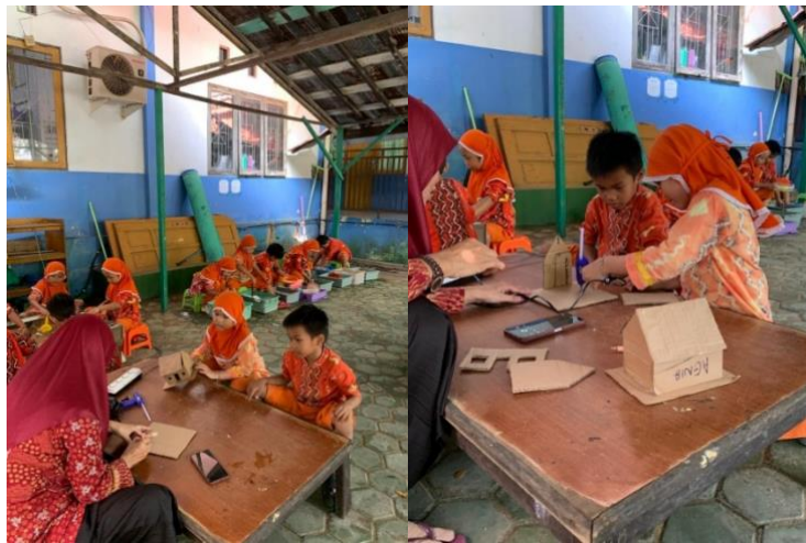
Gambar 4.14 Kegiatan Anak Membuat Rekayasa Rumah Sederhana dari Kardus (CLFKP.5.6) 18

Pada sentra alam, kegiatan main konstruktif terlihat ketika anak-anak membuat rekayasa rumah sederhana dari kardus dan menyusun bahan-bahan alam menjadi bentuk tertentu. Selain itu eksperimen Pelangi juga termasuk kegiatan konstruktif karena melibatkan proses berpikir dan menemukan.