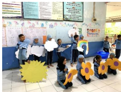
Gambar 4.12 Kegiatan sentra GambPeran Pada Saat Pelangi Timbul (CLFKP.5.5) 16