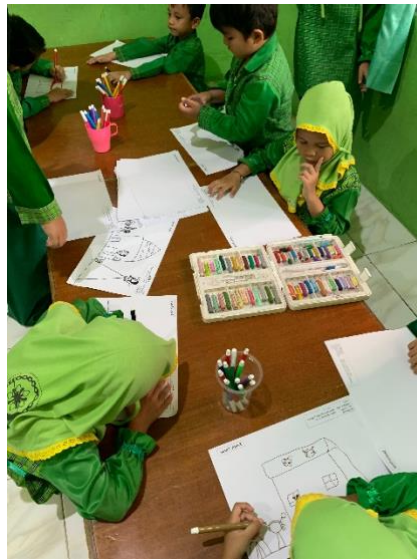
Gambar 4.7 Kegiatan Anak Menggambar(DLFKP.5.5) 11

Kemudian anak-anak menggambar bebas sesuai tema, kegiatan ini masuk ke sentra sensorimotor, karena melibatkan koordinasi mata dan tangan.