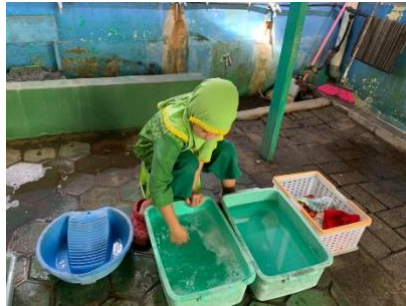
Gambar 4.20 Kegiatan Anak Bermain Mencuci Pakaian(CLFKP.5.6) 24

Kegiatan main sensorimotor pada sentra peran terlihat pada saat anak-anak bermain air, pasir, mencuci piring, pakaian, menuangkan air ke dalam botol menggunakan spons, dan mencap menggunakan pelepah pisang dan buah belimbing.