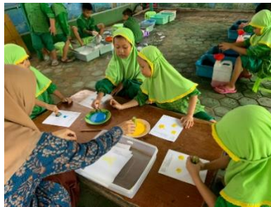
Gambar 4.18 Kegiatan Mencap Bulan dan Bintang

Menggunakan Media Pelelah Pisang dan Buah Belimbing (CLFKP.5.6) 22