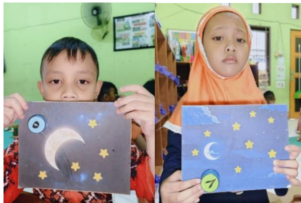
Gambar 4.28 Kegiatan Anak Menghitung Bintang (CLFKP.5.7) 32