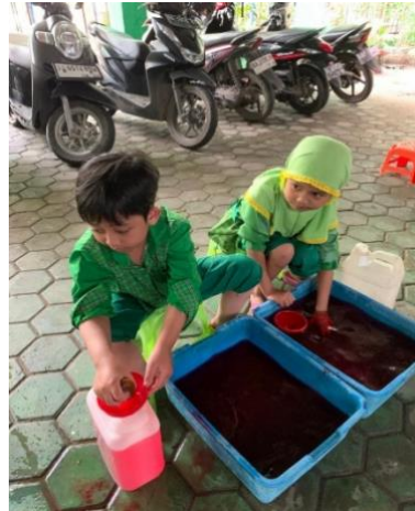
Gambar 4.22 Kegiatan Anak Bermain Menuang Air dalam Botol Menggunakan Spons (CLFKP.5.6) 26