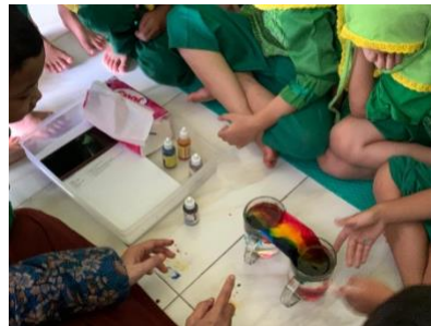
Gambar 4.16 Kegiatan Ibu Memperaktekkan Eksperimen Pelangi (CLFKP.5.6) 20