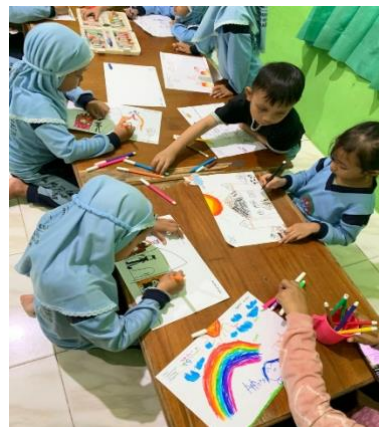
Gambar 4. 13 Kegiatan Menggambar di Sentra Peran (CLFKP.5.5) 17