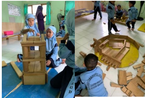
Gambar 4.2 Kegiatan Anak Membangun Balok Bentuk Rumah (DLFKP.5.4) 6

Kegiatan main sensorimotor pada saat sentra balok terlihat pada saat anak memegang, menyusun, memindahkan, dan merasakan tekstur balok secara langsung. Selain itu kegiatan mencetak geometri juga melibatkan koordinasi mata dan tangan serta stimulasi motorik halus.