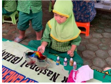
Gambar 4.17 Kegiatan Eksperimen Pelangi (CLFKP.5.6) 21