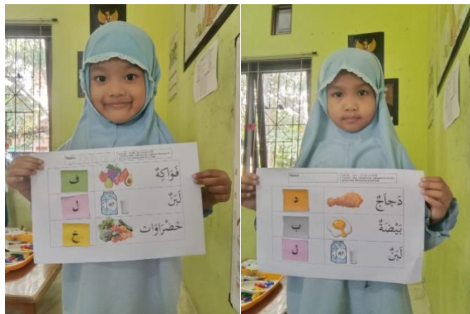
Gambar 4.25 Kegiatan Anak Menemukan Huruf Awal dari Kata (CLFKP.5.7) 29

Kegiatan main konstruktif pada sentra imtaq terlihat saat kegiatan mengisi piring makanan sesuai angka, grafik benda-benda langit, dan menghitung bintang. Kegiatan ini melatih kemampuan berpikir dan pemecahan masalah.