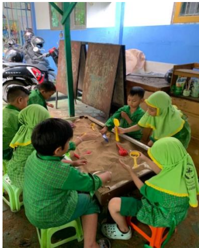
Gambar 4.21 Kegiatan Anak Bermain Pasir (CLFKP.5.6) 25

Kegiatan main sensorimotor pada sentra peran terlihat pada saat anak-anak bermain air, pasir, mencuci piring, pakaian, menuangkan air ke dalam botol menggunakan spons, dan mencap menggunakan pelepah pisang dan buah belimbing.