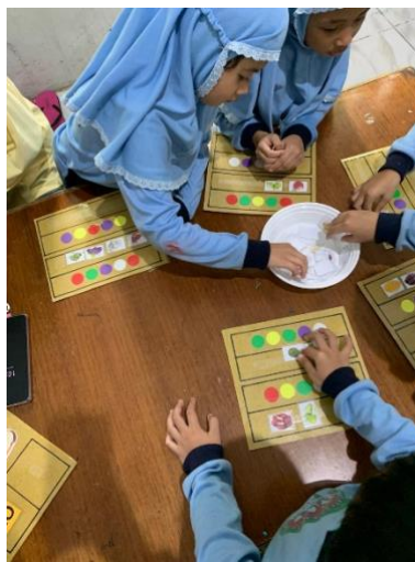
Gambar 4.29 Kegiatan Anak Menyusun Buah Sesuai warna (CLFKP.5.8) 33

Kegiatan main konstruktif pada sentra persiapan terlihat pada saat aktivitas anak melakukan proses menyusun, mengelompokkan, dan menyesuaikan objek dengan warna. Dan pada saat anak mencocokkan suku kata, karena anak-anak membangun pemahaman Bahasa dengan menyusun dan mencocokkan bagian-bagian kata.