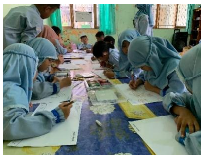
Gambar 4.5 Kegiatan menggambar bebas benda-benda langit (DLFKP.5.4) 9

Kegiatan main konstruktif terlihat pada saat anak-anak menyusun balok menjadi rumah, dan bentuk benda-benda langit, pada kegiatan