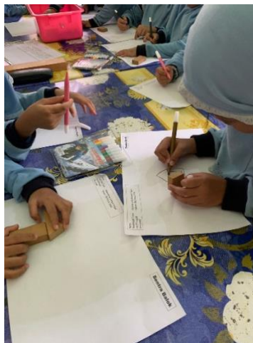
Gambar 4.3 Kegiatan Mencetak Geometri (DLFKP.5.4) 7