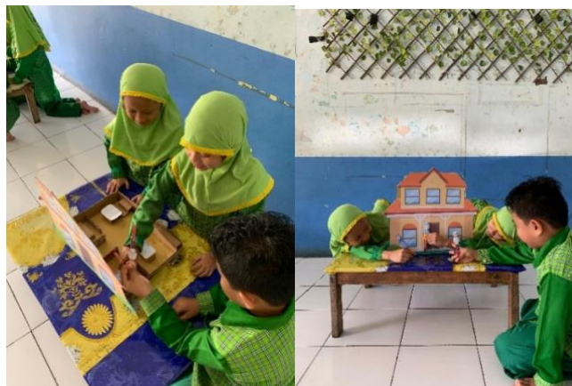
Gambar 4.6 Kegiatan Bermain Peran Micro (DLFKP.5.5) 10

Kegiatan main peran menjadi kegiatan yang utama pada sentra ini, seperti bermain peran menjadi aya, ibu, kakak, dan adik, anak anak memerankan berbagai tokoh, dan situasi yang mereka alami dalam kehidupan sehari hari.