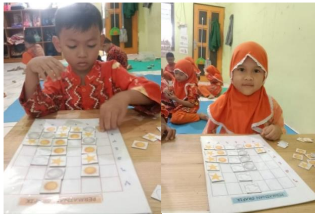
Gambar 4.27 Kegiatan Anak Grafik Benda-benda langit (CLFKP.5.7) 31