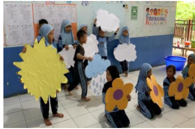
Gambar 4.11 Kegiatan Main Peran Pada Saat Hujan (CLFKP.5.5) 15