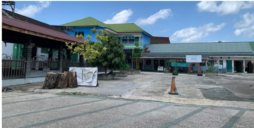
Gambar 4. 2 Yayasan Madinatul Taqwa