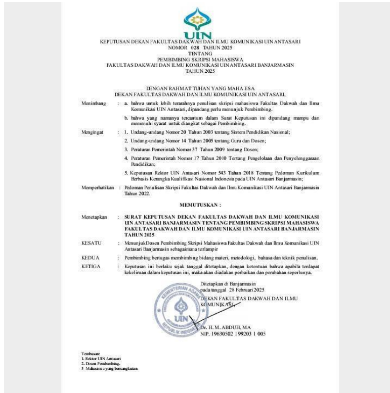
Lampiran : SURAT KEPUTUSAN DEKAN FAKULTAS DAKWAH DAN ILMU KOMUNIKASI UIN ANTASARI NOMOR 028 TAHUN 2025 TENTANG PEMBIMBING SKRIPSI MAHASISWA FAKULTAS DAKWAH DAN ILMU KOMUNIKASI UIN ANTASARI BANJARMASIN TAHUN 2025