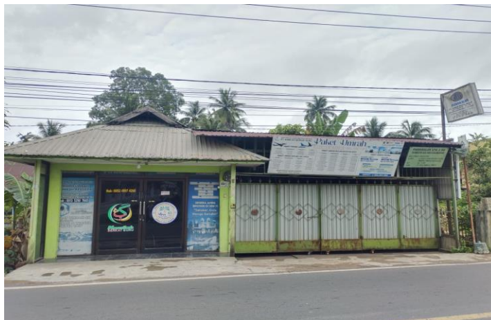
Gambar 4. 1 Kantor PT. Kamilah Berkah Guru Amuntai