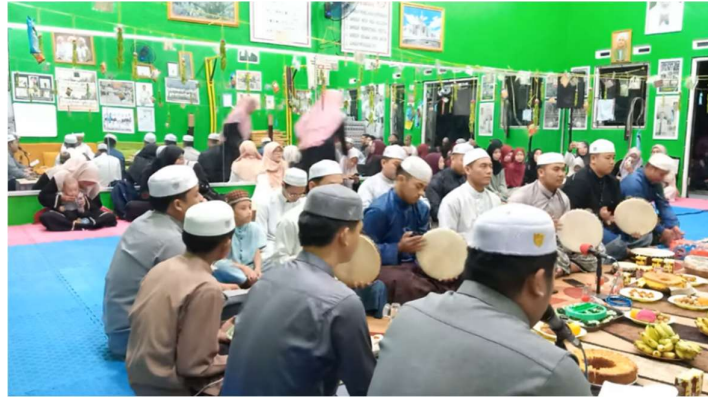
Gambar 4.7 Kegiatan Undangan Isra Mi'raj Majelis Sholawat Miftahussalam.