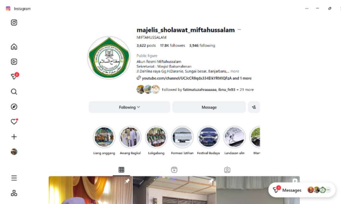
Gambar 4.9 Instagram Majelis Sholawat Miftahussalam