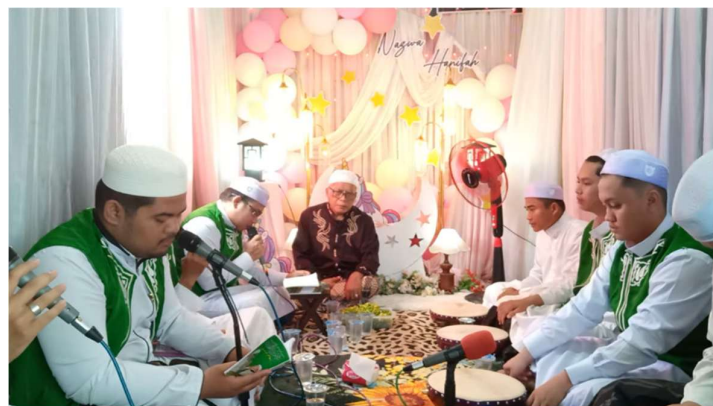
Gambar 4.4 Kegiatan Undangan Tasmiyah Majelis Sholawat Miftahussalam Banjarbaru