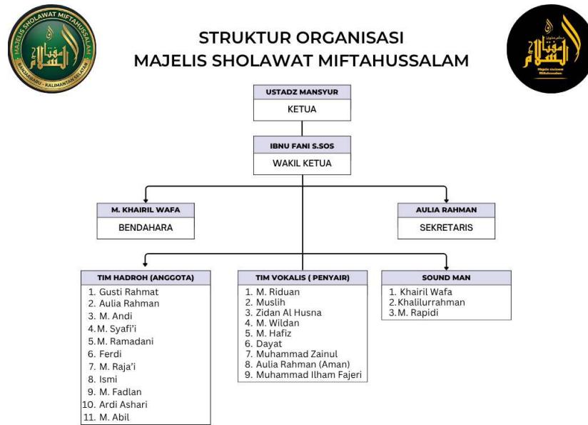
Gambar 4.1 Struktur Organisasi Majelis Sholawat Miftahussalam Banjarbaru.