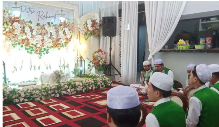
Gambar 4.5 Kegiatan Undangan Pernikahan Majelis Sholawat Miftahussalam Banjarbaru