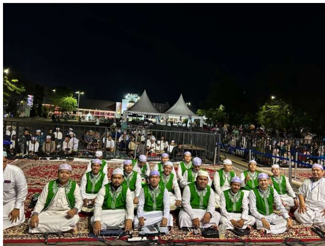
Gambar 4.6 Kegiatan Undangan Tabligh Akbar Majelis Sholawat Miftahussalam.