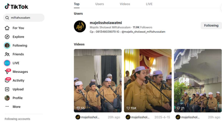
Gambar 4.10 Tiktok Majelis Sholawat Miftahussalam