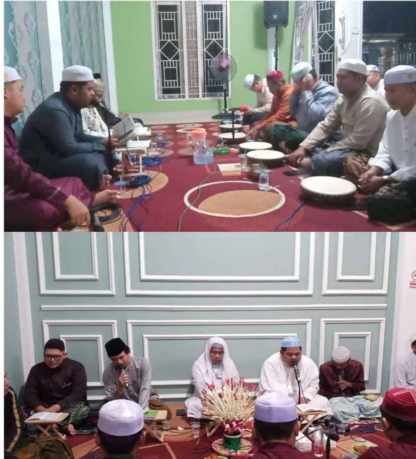
Gambar 4.2 Kegiatan Rutinan Majelis Sholawat Miftahussalam Banjarbaru