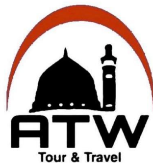
Gambar 4. 2 Logo PT. Avicenna Taibah Wisata Banjarbaru