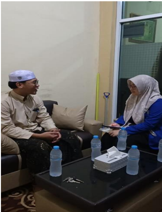
Dokumentasi informan (Pengajar)