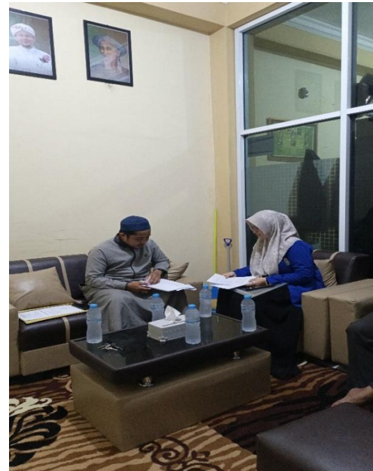
Dokumentasi informan (Kepala Sekolah)