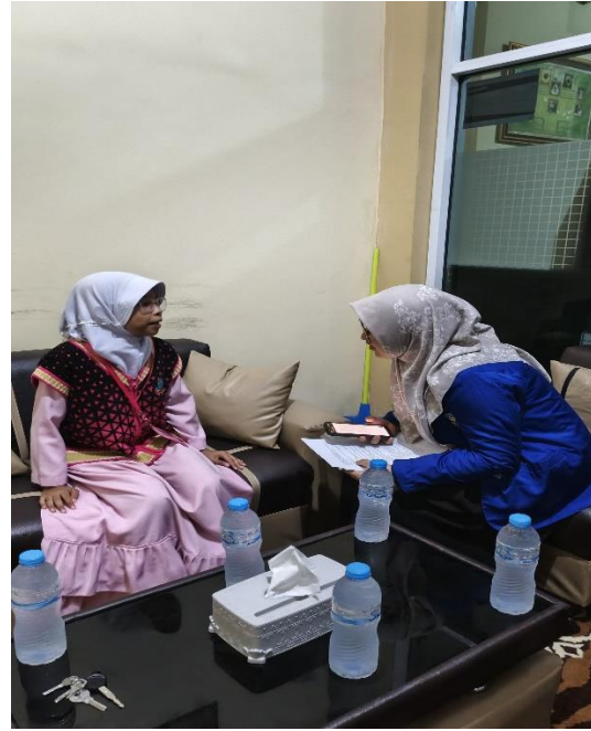
Dokumentasi informan (Santriwati)