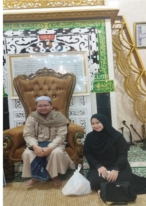
Dokumentasi Informan (Pengasuh MDT)