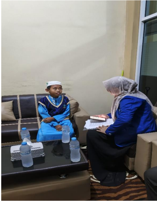
Dokumentasi informan (Santri)