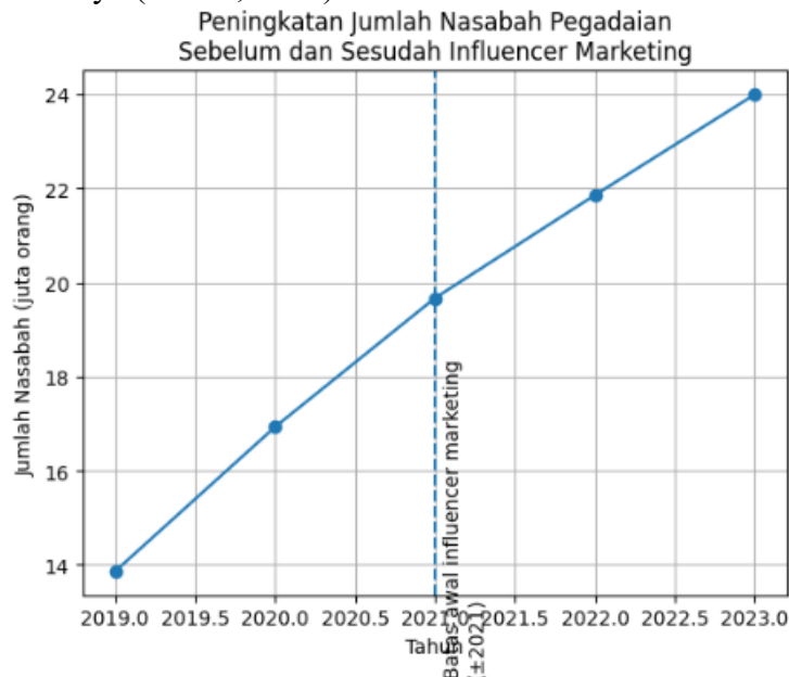
Gambar 1. 1 Grafik Peningkatan Jumlah Nasabah Pegadaian Tahun 2019–2023

berlanjut hingga tahun 2025 ini dan diperluas ke berbagai kegiatan sosial serta komunitas lainnya (Seruni, 2022).