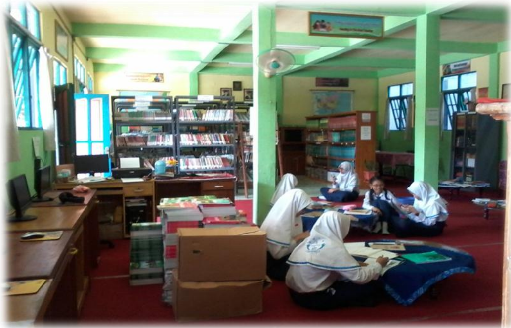
Foto Perpustakaan SMP Negeri 1 Banjarmasin