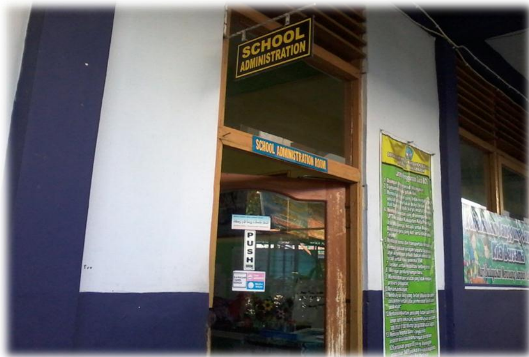
Foto Ruangan Tata Usaha SMP Negeri 1 Banjarmasin