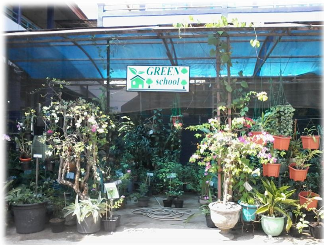
Foto Green School SMP Negeri 1 Banjarmasin