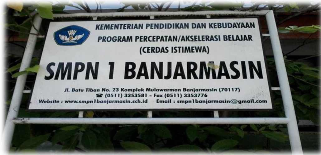
Foto Denah dan lingkungan SMP Negeri 1 Banjarmasin