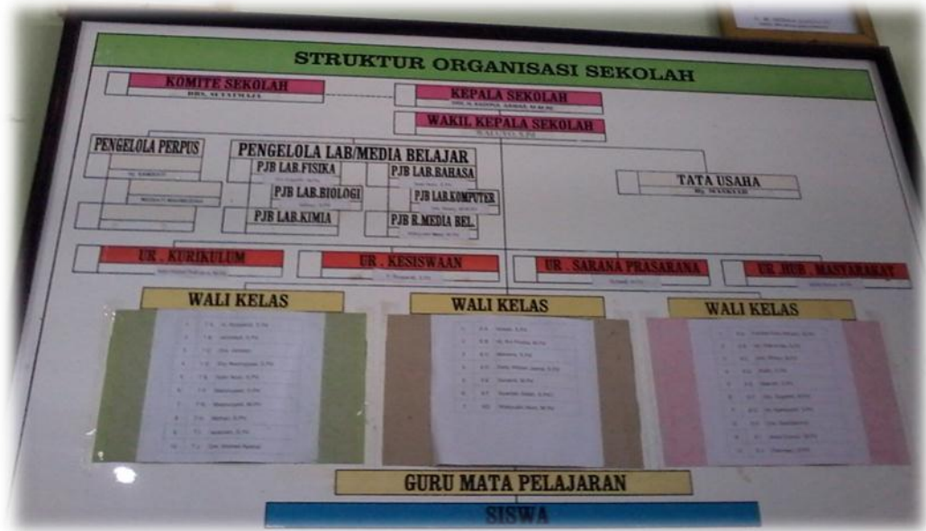
Foto Struktur Organisasi SMP Negeri 1 Banjarmasin