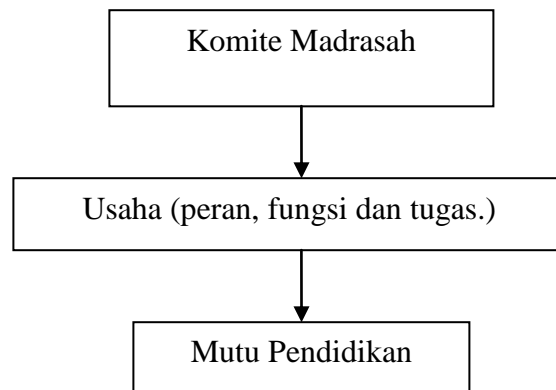
Gambar 1. Kerangka pemikiran

Pada skema di atas dapat dipahami bahwa Komite Madrasah yang memaksimalkan usahanya baik yang menyangkut peran, fungsi dan tugas akan menghasilkan mutu pendidikan yang tinggi. Demikian pula sebaliknya jika Komite Madrasah tidak memaksimalkan usahanya baik menyangkut peran, fungsi dan tugas maka mutu pendidikan akan rendah. Kemudian peneliti mencoba meneliti upaya