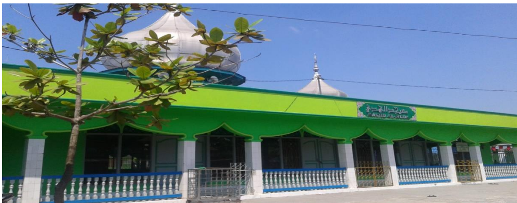
Mesjid Al-Huda sebagai fasilitas penerapan shalat Dhuha