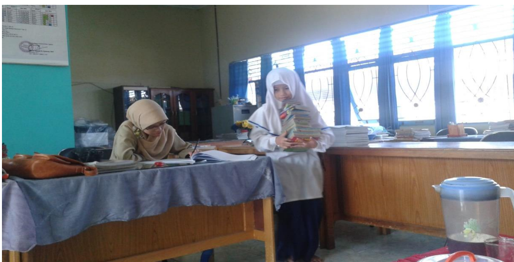
Siswi membantu guru dalam membawa kamus