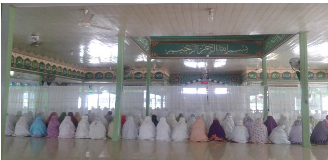
Pelaksanaan shalat Dhuha