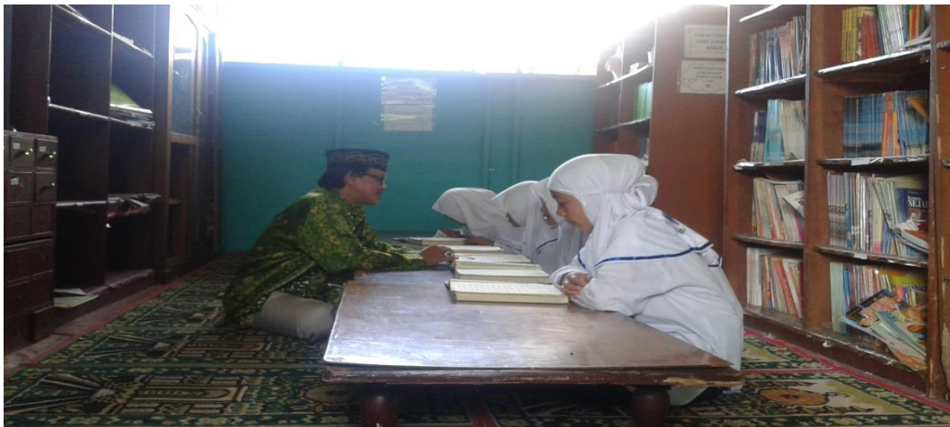
Ruang belajar Ilmu Tajwid dan Praktiknya