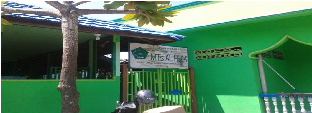
Pintu Masuk MTs Al-Huda Banjarmasin