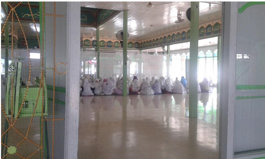
Pelaksanaan pembacaan QS. Yaasin, QS. Waqiah, dan shalawat Kamilah