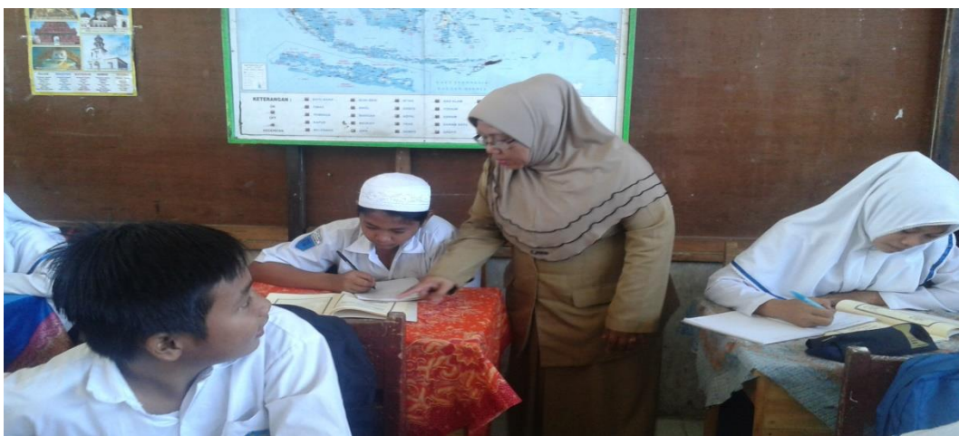
Kegiatan Belajar Mengajar di MTs Al-Huda Banjarmasin