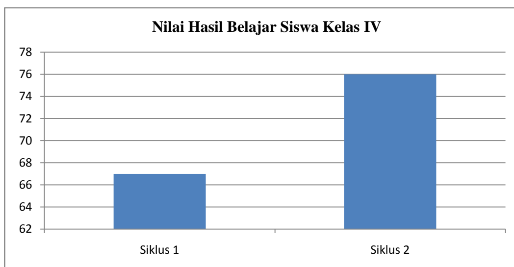
Gambar 4.3 Grafik Hasil Belajar Siswa dengan Penerapan Cooperative Learning