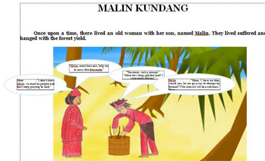
Gambar 2.1 Komik tentang kisah Malin Kundang.