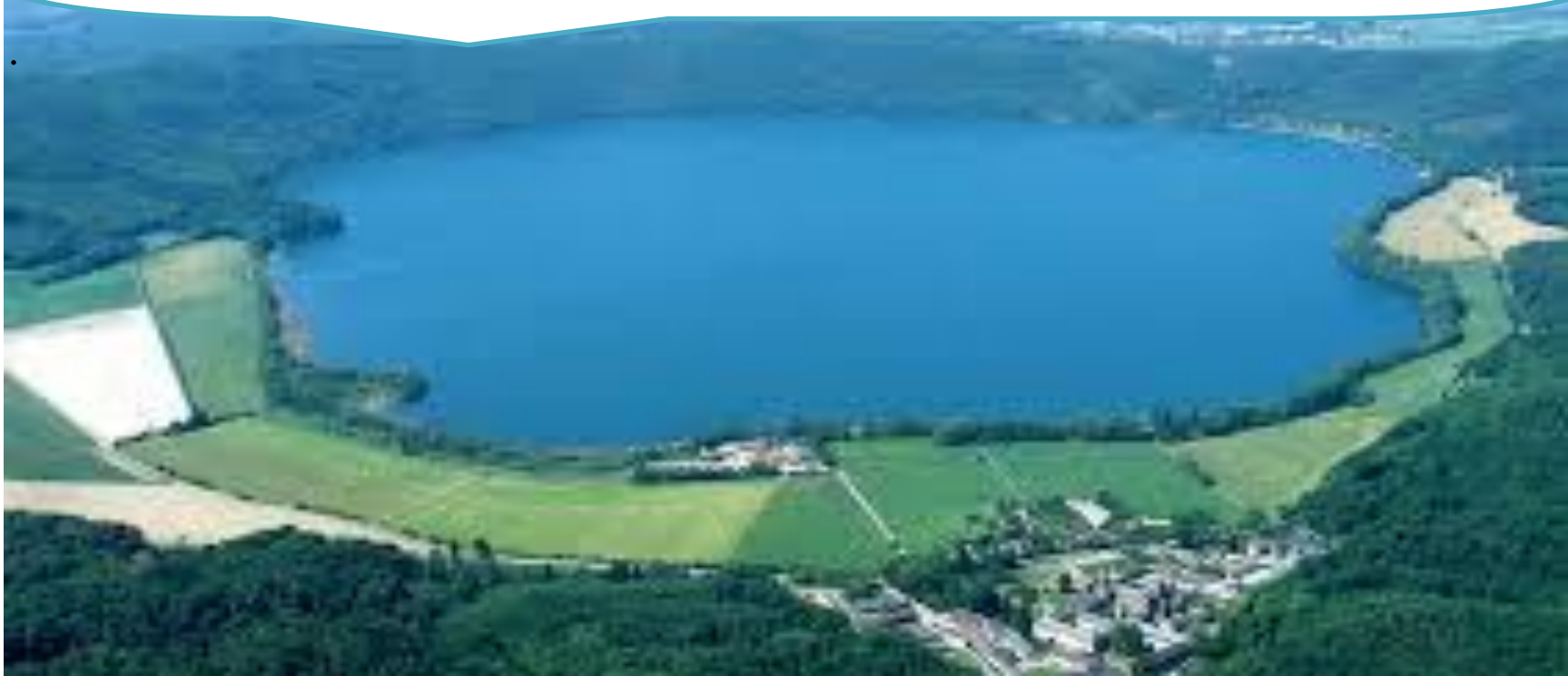
The Story of Sangkuriang and Tangkuban Perahu Mountain

The mother was very annoyed. Batara Guru broke his promise. The mother was shouting angrily. Then the earth began to shake. Volcanoes started to erupt. The earth formed a very big hole. People believed that the big hole became a lake. Then this lake is known as Toba lake.