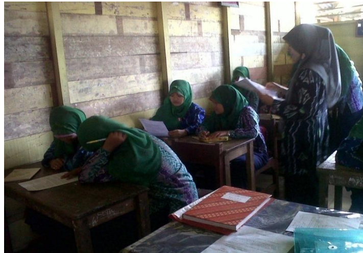
Gambar 4.2. Guru berkeliling untuk memberikan motivasi dan bimbingan kepada siswa untuk membuka ide kreatif yang dimilikinya.

Setelah 10 menit berlalu, siswa melakukan diskusi dengan berpartisipasi aktif dalam diskusi tersebut. Pada pertemuan pertama diskusi hanya diikuti oleh siswa yang hanya mempunyai kemampuan tinggi karena siswa belum terbiasa dengan pembelajaran yang menggunakan pendekatan open-ended , sehingga pada awal-awal pembelajaran situasi kelas menjadi lebih pasif. Siswa juga belum sepenuhnya memahami maksud dari pembelajaran dengan menggunakan pendekatan open-ended sehingga terlihat ada beberapa siswa yang malas mengerjakan soal yang telah diberikan terutama siswa dengan kemampuan matematika rendah. Untuk mengatasi hal tersebut, guru terus menerus memotivasi dan membimbing siswa.