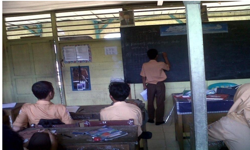
Gambar 4.4. Siswa melakukan diskusi kelas dengan memaparkan jawabannya yang ditulis di papan tulis.

Setelah mempresentasikan jawaban, guru memberikan bimbingan dan pengarahan tentang permasalahan yang diberikan dengan menggunakan media pembelajaran yang telah dipersiapkan sebelumnya. Dan kegiatan inti yang terakhir yaitu siswa melakukan modifikasi pendapat-pendapat atas jawaban yang tak lengkap atau salah dengan bantuan dan bimbingan guru sehingga dapat membuat kesimpulan akhir dari pembelajaran yang telah dipelajari.