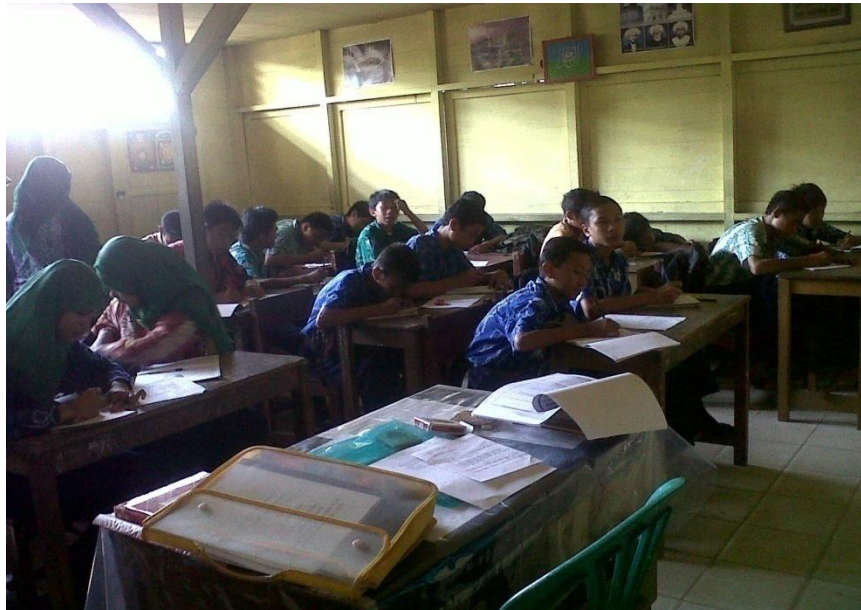
Gambar 4.3. Siswa melakukan diskusi kelas dan mencatat respon yang memaparkan ide kreatifnya.

ide untuk menyelesaikan masalah dan siswa lain menanggapi. Selama kegiatan diskusi berlangsung siswa menuliskan penyelesaian yang dibuat dengan memberikan alasan atas jawabannya dipapan tulis kemudian mempresentasikan hasil jawabannya. Setelah itu, masing-masing siswa mulai mencatat presentasi atas jawaban yang dikemukakan oleh siswa lain.