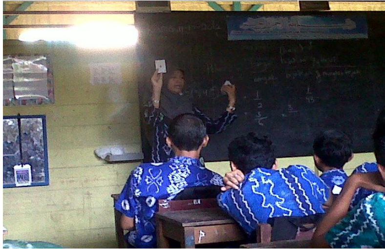
Gambar 4.5. Guru menuntun siswa untuk mengeluarkan ide kreatifnya dengan menggunakan media pembelajaran berupa kartu brige.