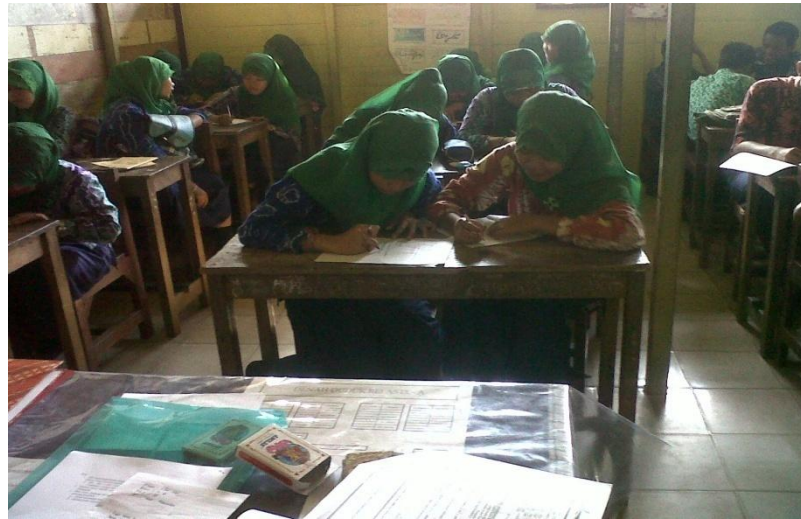
Gambar 4.1. Siswa sedang berdiskusi dengan teman sebangkunya pada saat diberikan permasalahan.

diberikan didiskusikan pada teman sebangku siswa. Masalah yang diberikan adalah masalah kontekstual dengan tingkat kesulitan yang disesuaikan dengan kemampuan siswa agar lebih mudah dipahami.