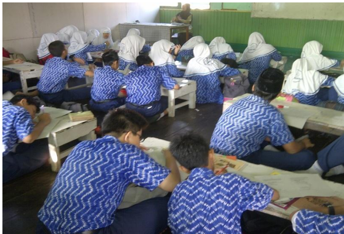
Gambar 4.3 Suasana Evaluasi Akhir

Setelah melakukan kegiatan pembelajaran, guru mengadakan evaluasi akhir. Evaluasi ini bertujuan untuk mengetahui bagaimana hasil belajar siswa.