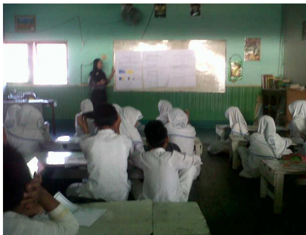
Gambar 4. 1 Aktivitas Guru Saat Penyajian Materi

Guru menyajikan informasi tentang materi operasi hitung bentuk aljabar menggunakan alat peraga kartu aljabar sesuai dengan rencana pelaksanaan pembelajaran yang telah dibuat disertai dengan memberikan contoh-contoh soal dan cara menyelesaikannya. Setelah selesai menyajikan informasi, guru mengadakan tanya jawab dengan siswa untuk mengetahui pemahaman terhadap materi yang telah diberikan, dan memberikan kesempatan yang sama kepada siswa untuk bertanya.