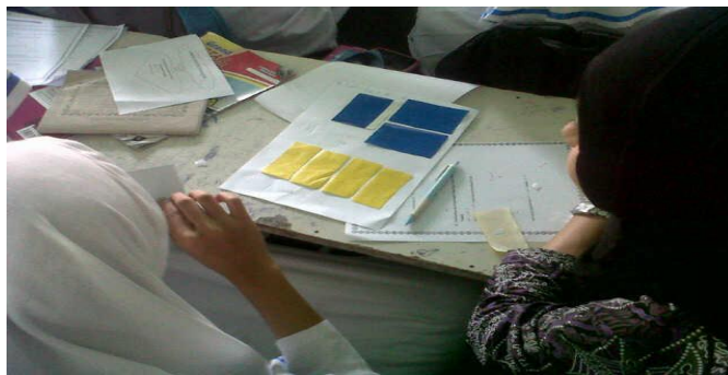
Gambar 4. 2 Aktivitas Siswa Dalam Kelompok

Guru memberikan arahan dalam belajar kelompok. Selama diskusi berlangsung, guru memantau kerja tiap kelompok dan membantu kelompok yang mengalami kesulitan jika ada hal-hal yang belum mereka pahami. Dalam kelompok, siswa membahas tugas yang diberikan oleh guru.