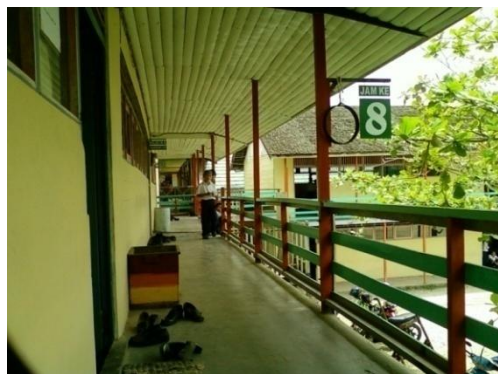
Gambar 4. 1 Depan ruang guru