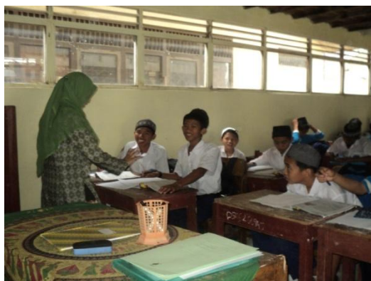
Gambar 4. 7. Melakukan tanya jawab kepada siswa