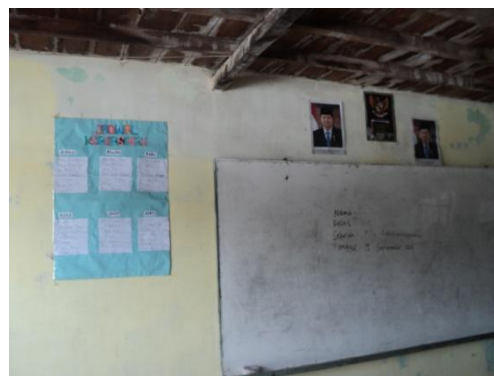
Gambar 4. 4. Salah satu ruangan kelas

Mengingat MTs Raudhatussyubban Kab. Banjar berada di lingkungan kompleks sekolah yang menyatu dengan MA Raudatussyubban sehingga ada beberapa sarana dan prasarana tertentu yang merupakan hak milik bersama antara MTs dan MA Raudhatussyubban. Contohnya seperti WC, tempat parkir, ruang guru, lab. komputer, ruang kepala sekolah dan ruang dewan guru. Sedangkan untuk ruang belajar/ruang kelas antara MTs dan MA Raudatussyubban mempunyai ruangan sendiri-sendiri.