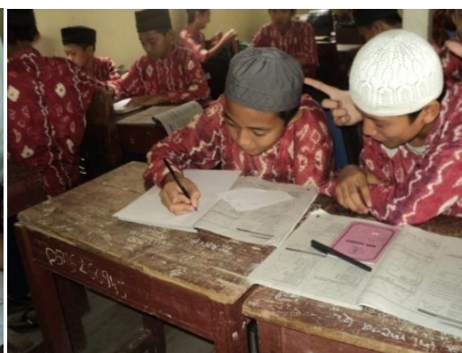
Gambar 4. 6 Siswa belajar pada tahap Analisis