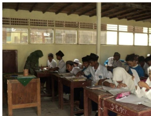
Gambar 4. 8. Membimbing siswa