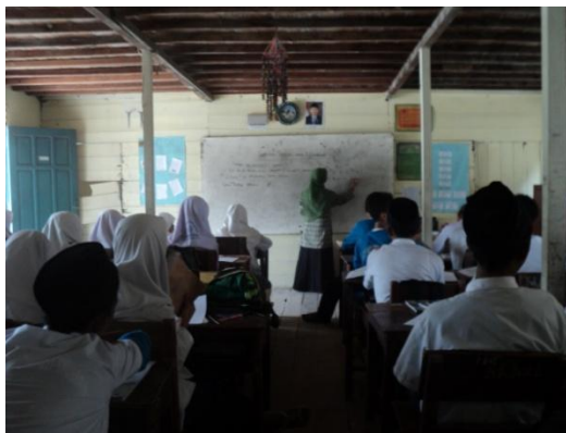
Gambar 4. 9. Menuntun siswa dengan memberikan contoh bangun datar yang lainnya di papan tulis