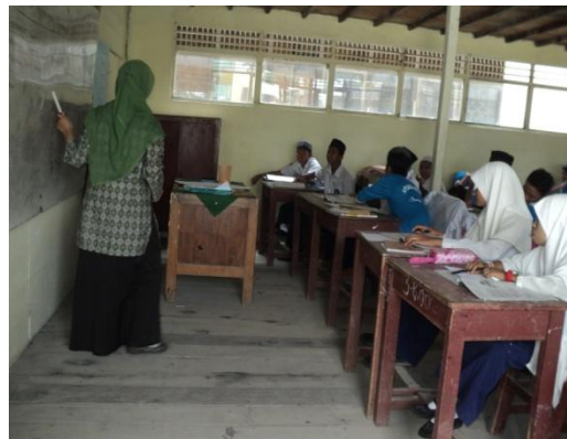
Gambar 4. 10. Memberikan contoh soal