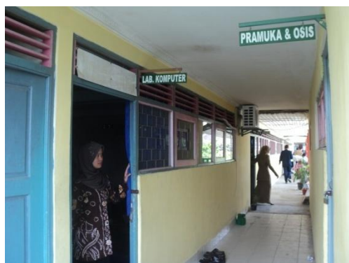
Gambar 4. 3. Lab Komputer dan Ruang Pramuka & OSIS tampak depan