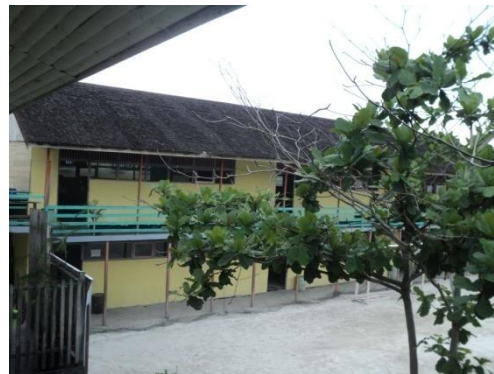
Gambar 4. 2 Ruang Kelas Tampak Dari Atas