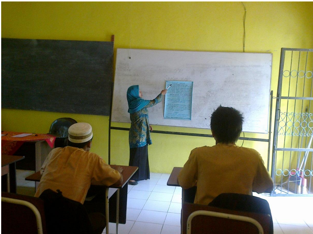
Gambar 4 Guru memasang caption dan menjelaskan materi pembelajaran