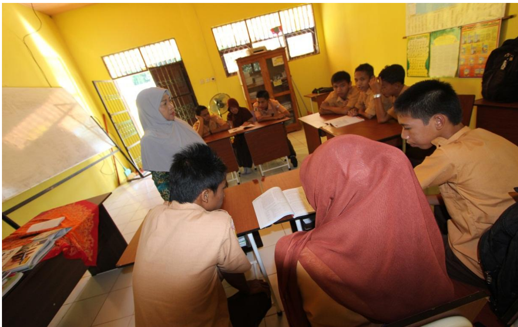
Gambar 6 Guru memberi kesempatan kepada siswa untuk bertanya