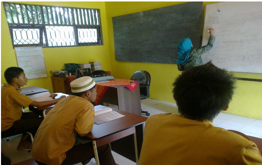
Gambar 2 Guru menuliskan hari,tanggal dan judul materi pembelajaran