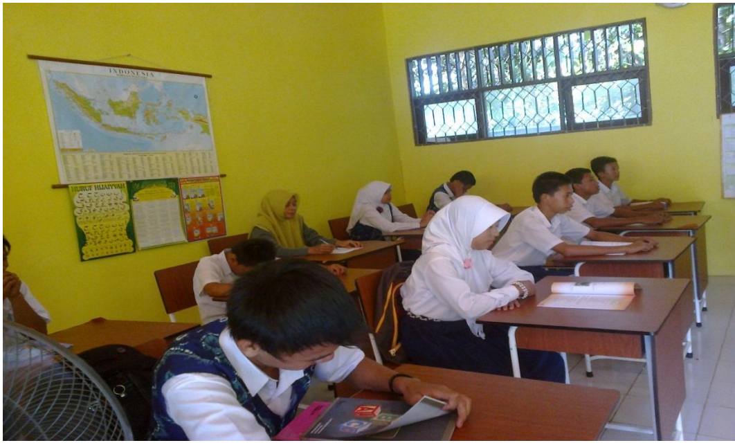
Gambar 7 Observer mengamati proses pembelajaran