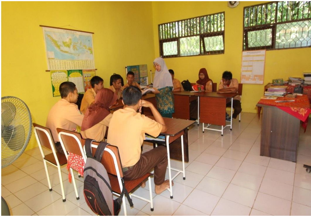
Gambar 5 Siswa memperhatikan dan mendengarkan penjelasan Guru