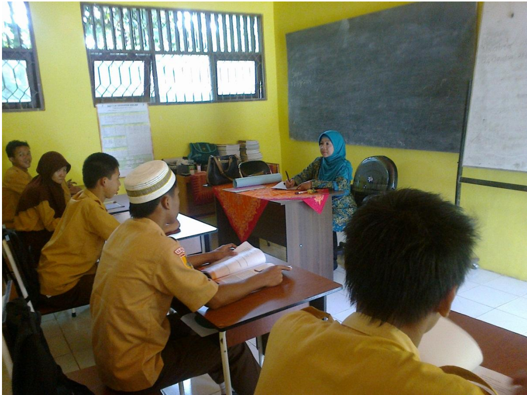
Gambar 1 Guru mengabsen siswa