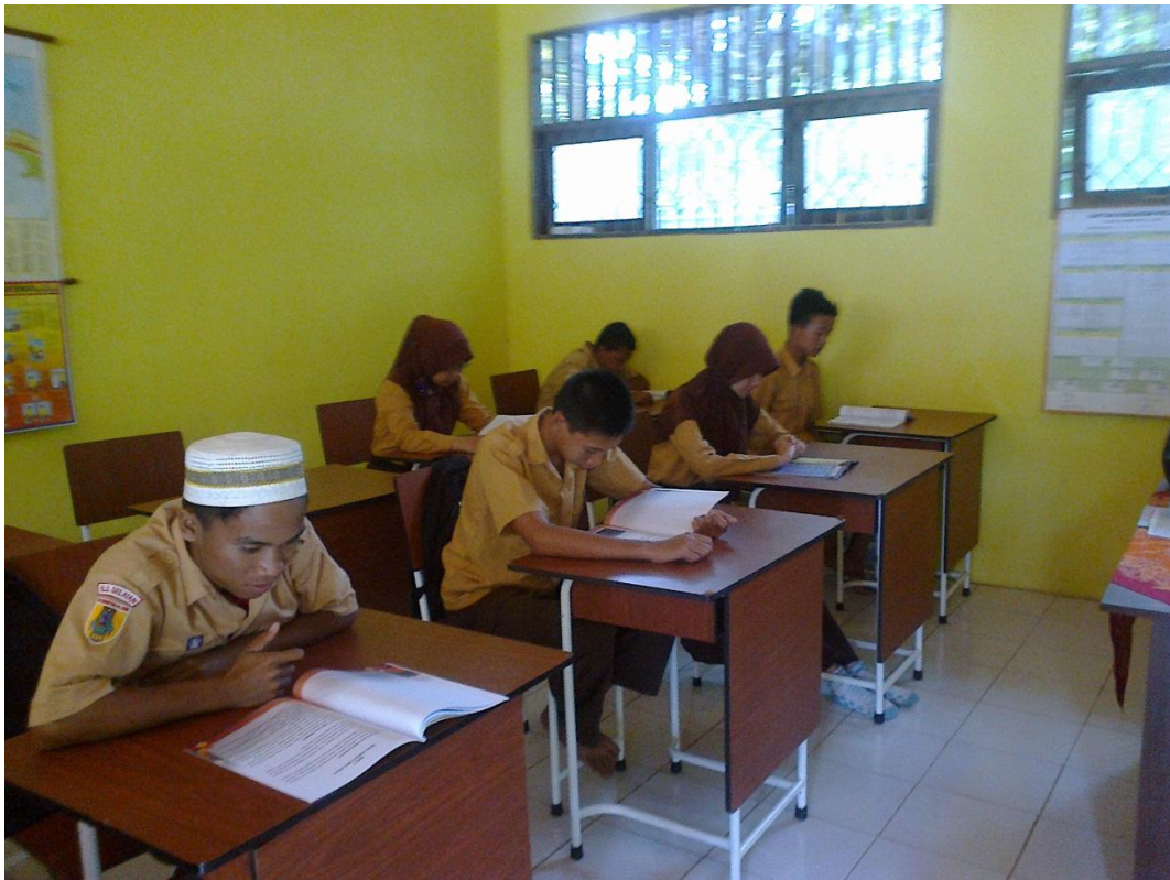
Gambar 3 Siswa sedang membaca materi pembelajaran