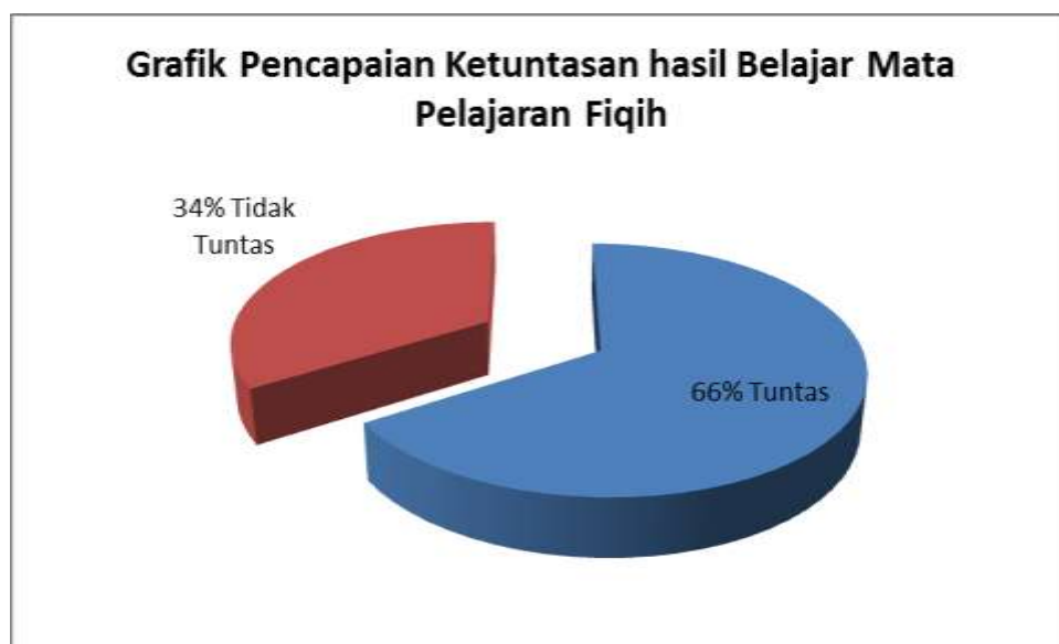
Grafik 4.2 : Pencapaian Ketuntasan Hasil Belajar Fiqih Materi Shalat Menggunakan Media Grafis di Kelas III MI Darussalam Kayu Rabah Siklus I Pertemuan Pertama

Untuk lebih jelasnya dapat dilihat pada grafik ketuntasan hasil di bawah ini: