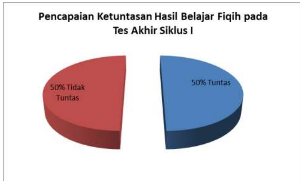
Grafik 4.3 : Pencapaian Ketuntasan Hasil Belajar Fiqih pada Tes Akhir Siklus I

Melihat dari nilai hasil belajar yang diperoleh siswa, penguasaan terhadap materi pembelajaran sudah baik namun masih ada siswa yang kurang memahami materi sehingga nilai hasil belajarnya belum mencapai tuntas sesuai dengan KKM mata pelajaran fiqih. Berdasarkan tabel 4.8 dan grafik 4.3 di atas, maka dapat disimpulkan bahwa pembelajaran Fiqih materi shalat menggunakan media grafis berupa poster pada siklus 1 pertemuan kedua belum sepenuhnya berhasil sebab siswa masih belum mencapai ketuntasan 100% baik secara klasikal maupun individual untuk itu akan dilakukan perbaikan pada siklus II.