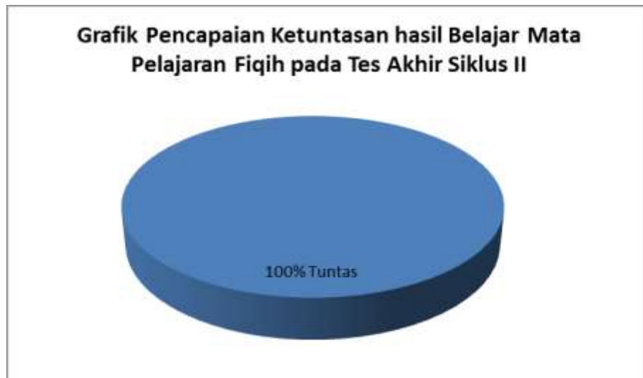
Grafik 4.5 : Pencapaian Ketuntasan Hasil Belajar Fiqih pada Tes Akhir Siklus II

Melihat dari nilai hasil belajar yang diperoleh siswa, penguasaan terhadap materi pembelajaran sudah baik sekali sehingga nilai hasil belajarnya mencapai tuntas 100% secara individu sesuai dengan KKM mata pelajaran Fiqih. Berdasarkan tabel 4.15 dan grafik 4.5 di atas, maka dapat disimpulkan bahwa pembelajaran Fiqih materi shalat menggunakan media grafis berupa poster pada siklus II pertemuan kedua sudah sepenuhnya berhasil sebab siswa sudah mencapai ketuntasan 100% baik secara klasikal maupun individual untuk itu pembelajaran Fiqih menggunakan media grafis akan sering digunakan sesuai pokok bahasannya.