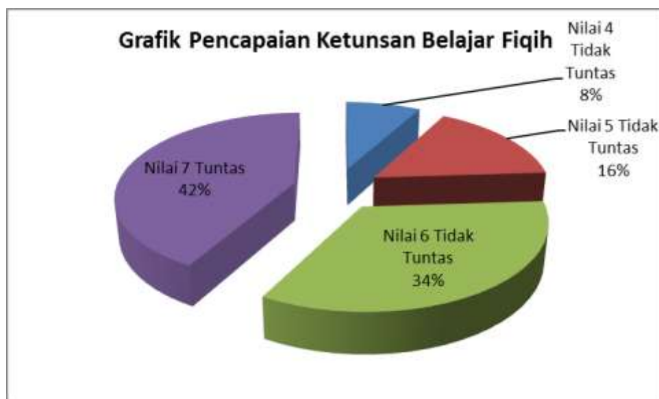
Grafik 4.1: Nilai Hasil Belajar Mata Pelajaran Fiqih

Untuk grafik nilai siswa pada pembelajaran Fiqih dapat dilihat pada grafik di bawah ini: