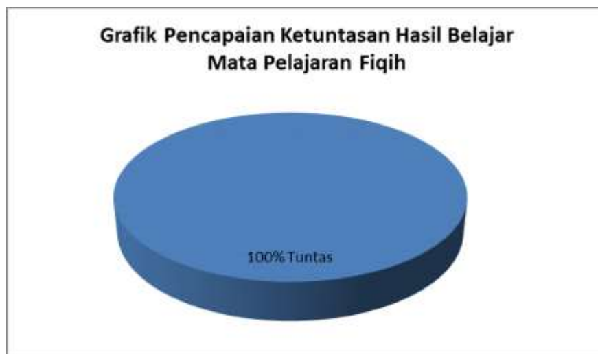
Grafik 4.4 : Pencapaian Ketuntasan Hasil Belajar Fiqih Materi Shalat Menggunakan Media Grafis di Kelas III MI Darussalam Kayu Rabah Siklus II Pertemuan Pertama

Melihat dari nilai hasil belajar yang diperoleh siswa, penguasaan terhadap materi pembelajaran sangat baik sehingga nilai hasil belajarnya sudah mencapai ketuntasan 100% sesuai dengan KKM mata pelajaran Fiqih. Berdasarkan tabel 4.12