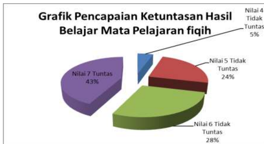
Grafik 4.1: Nilai Hasil Belajar Mata Pelajaran Fiqih

Perolehan hasil belajar tersebut dikarenakan kondisi umum setiap kali pembelajaran Fiqih selama ini masih bersifat monoton, sehingga siswa dalam kelas terlihat tidak bersemangat belajar, tidak aktif dan kreatif bahkan bersenda gurau