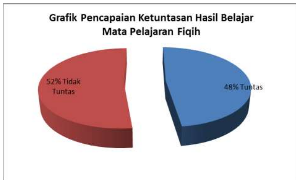
Grafik 4.2 : Pencapaian Ketuntasan Hasil Belajar Fiqih Materi Wudhu Melalui Metode Demonstrasi Di Kelas II MIN Karantina Siklus I Pertemuan Pertama

Melihat dari nilai hasil belajar yang diperoleh siswa, penguasaan terhadap materi pembelajaran cukup baik namun masih ada kelompok siswa yang kurang memahami materi sehingga nilai hasil belajarnya belum mencapai tuntas sesuai dengan KKM mata pelajaran Fiqih. Berdasarkan tabel 4.5 dan grafik 4.2 di atas, maka dapat disimpulkan bahwa pembelajaran Fiqih materi wudhu melalui penerapan metode demonstrasi pada siklus 1 pertemuan pertama belum sepenuhnya berhasil untuk itu akan dilakukan perbaikan pada siklus I pertemuan kedua.