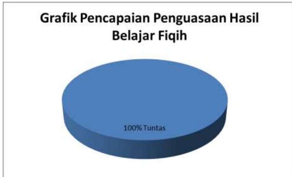
Grafik 4.4 : Pencapaian Ketuntasan Hasil Belajar Fiqih Materi Wudhu Melalui Metode Demonstrasi Di Kelas II MIN Karantina Siklus II Pertemuan Pertama

Melihat dari nilai hasil belajar yang diperoleh siswa, penguasaan terhadap materi pembelajaran sangat baik sehingga siswa mencapai tuntas 100% secara klasikal sesuai dengan KKM mata pelajaran Fiqih. Berdasarkan tabel 4.12 dan grafik 4.4 di atas, maka dapat disimpulkan bahwa pembelajaran Fiqih materi wudhu melalui penerapan metode demonstrasi pada siklus II pertemuan pertama sudah sepenuhnya berhasil secara klasikal untuk itu akan diadakan tes akhir siklus II untuk mengetahui pemahaman siswa pada materi wudhu secara individual.