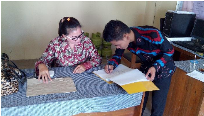
Wawancara Dengan Staf Kantor Desa Jorong