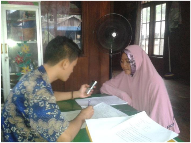
Wawancara Dengan Masyarakat Desa Jorong