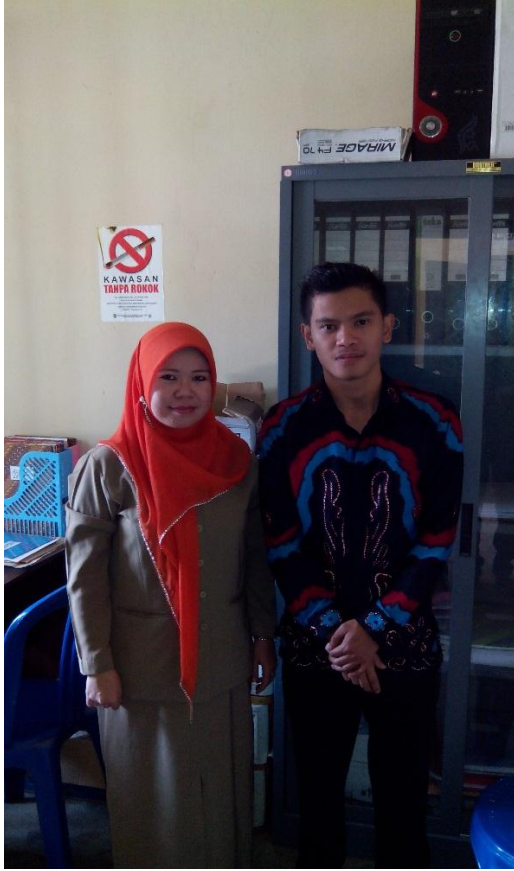
Foto Bersama SEKDES