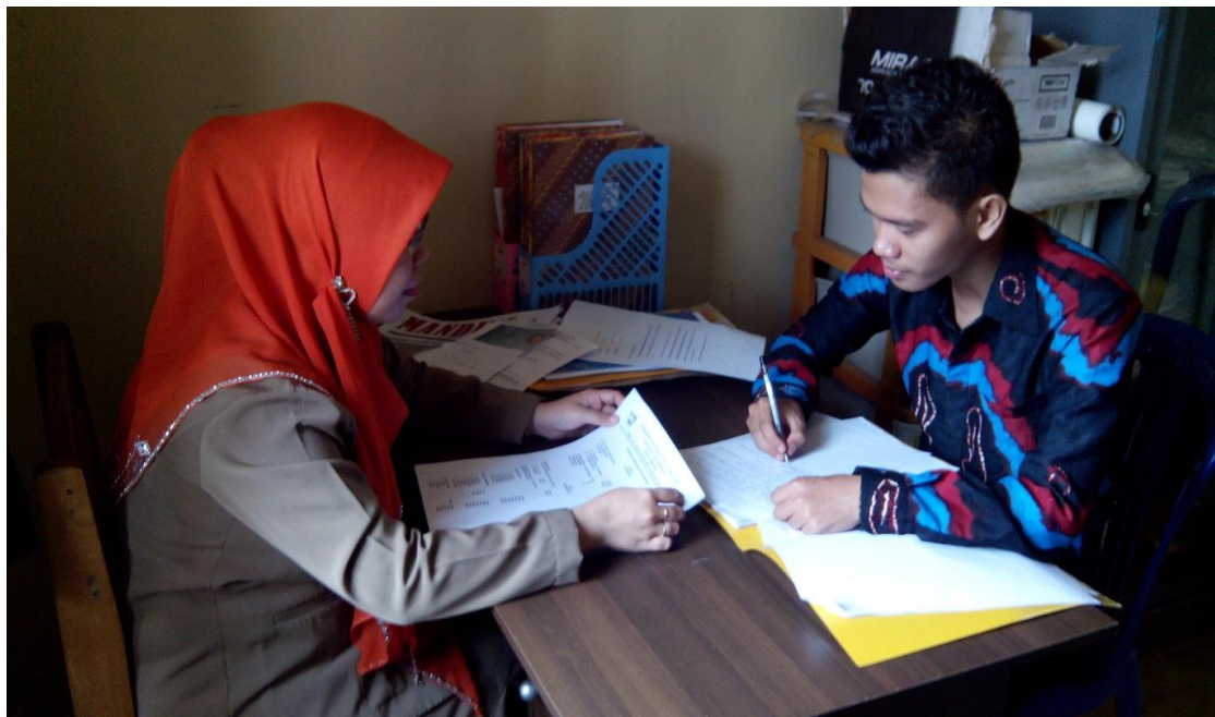
Wawancara Dengan Seketaris Desa