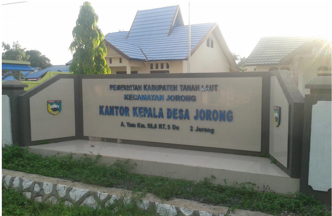
Kantor Desa Jorong