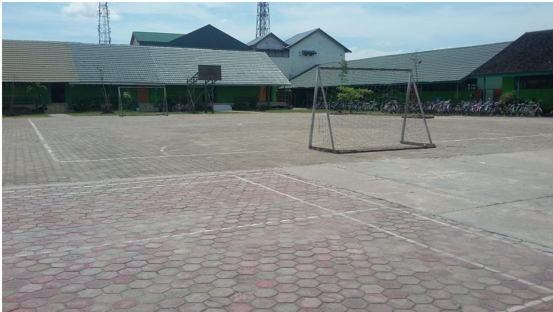
Lapangan Utama di MTsN Banjar Selatan 1