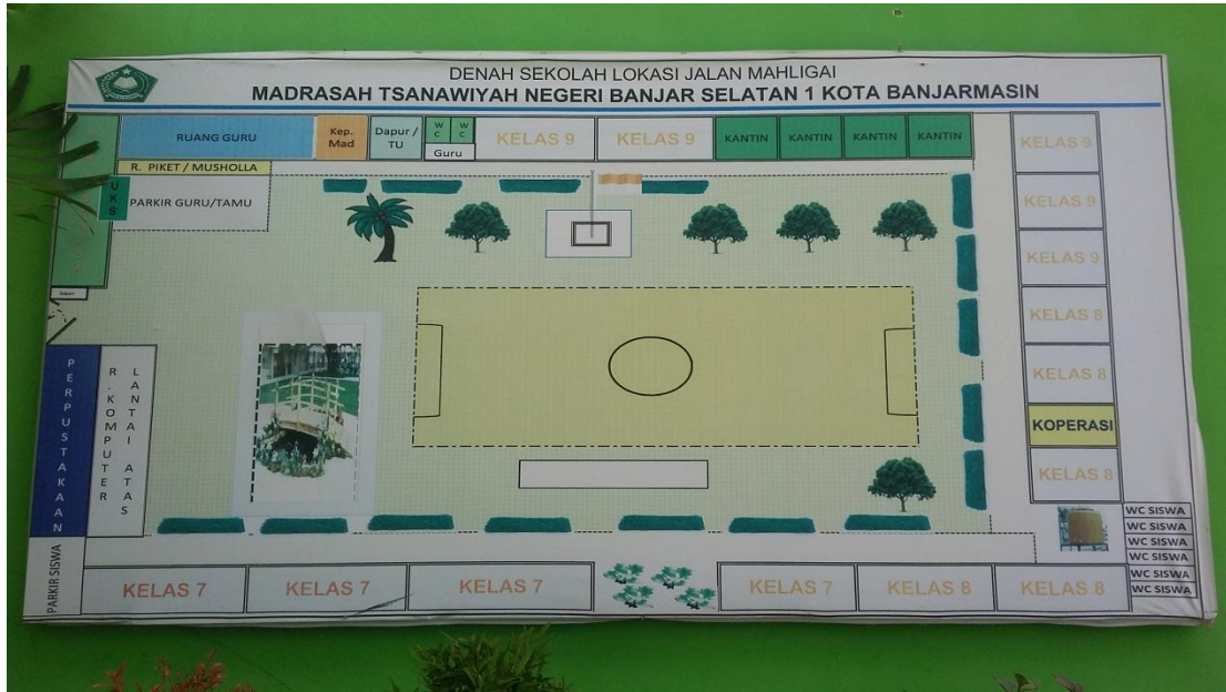
Denah Sekolah MTsN Banjar Selatan 1