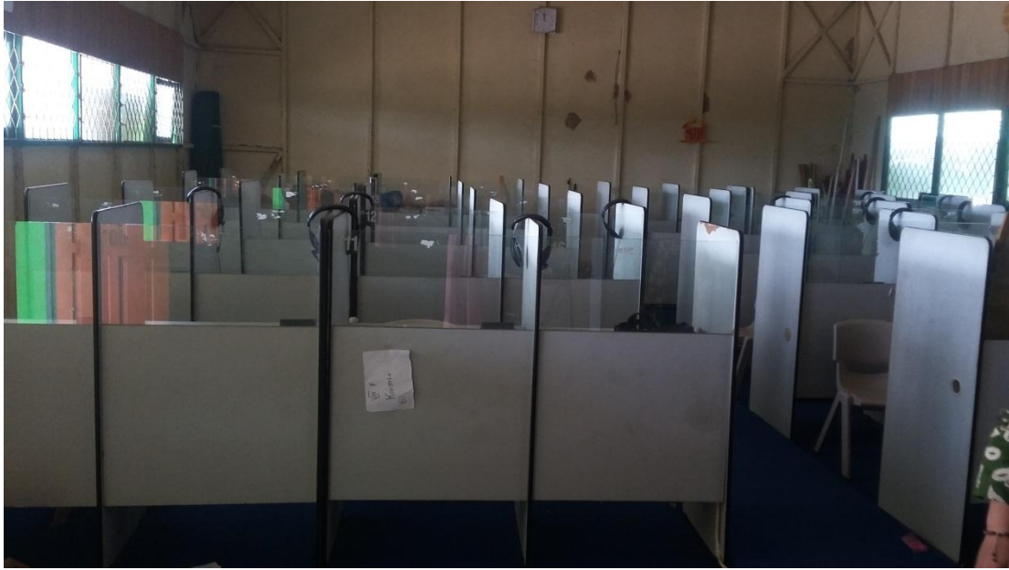
Ruang Laboratorium Bahasa