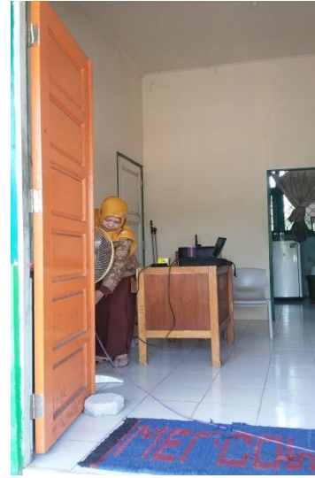
Ruang Guru BK