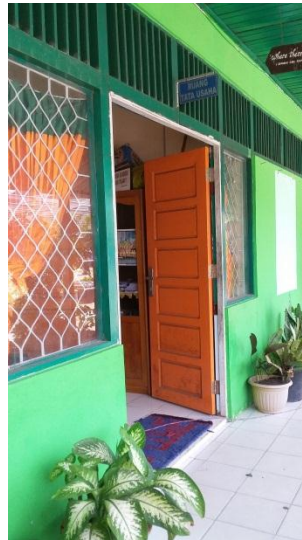
Ruang Tata Usaha & Bk