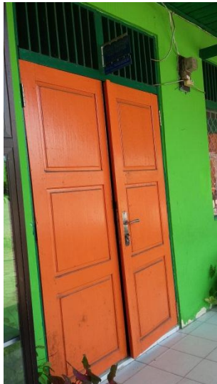
Ruang Kepala Sekolah