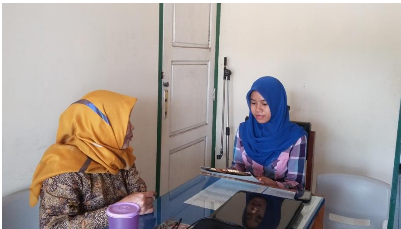
Proses Wawancara bersama Guru BK di MTsN Banjar Selatan 1