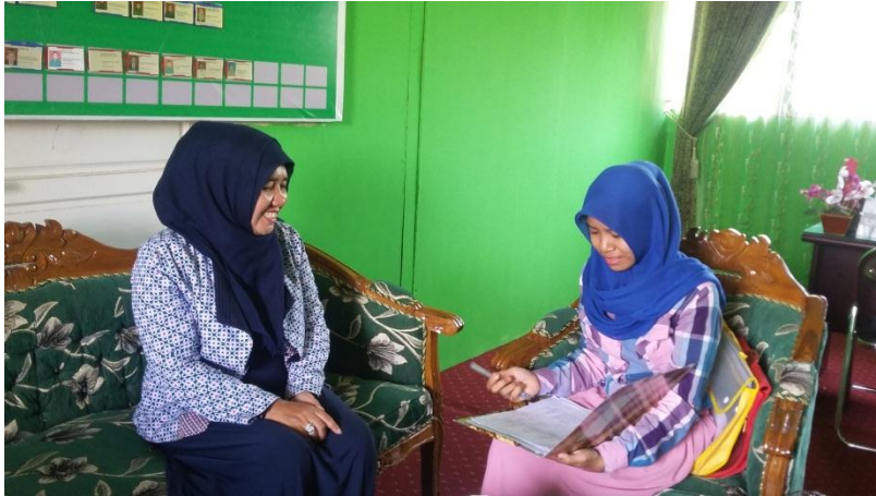
Proses Wawancara bersama Kepala Sekolah MTsN Banjar Selatan 1